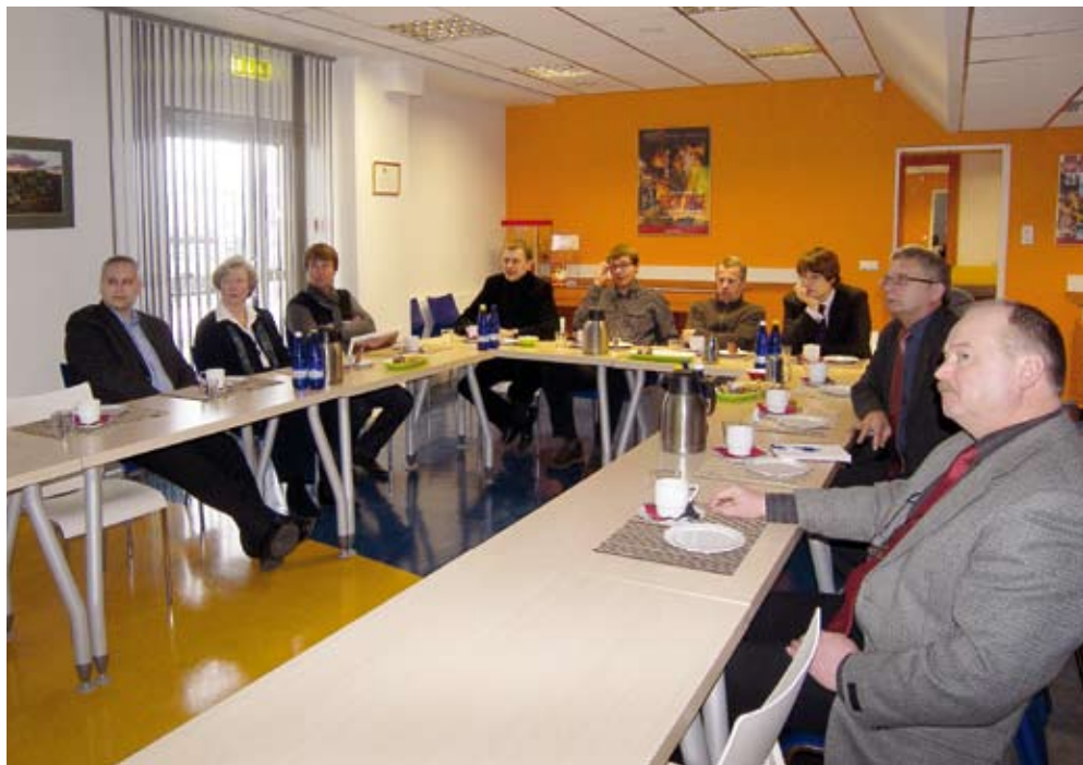
Reformierakonna saadikud Pauligis.

Küsimusele pensionäride ostujõu vähenemise kohta ning järeltule, et mõnikümne aastaga tagasi sai pensionär kuutoetuse eest osta 300 karbonaadi, vastasid publik ning Maripuu üheskoos, et tol ajal ei olnudki kusagilt karbonaadi saada, banaanidest rääkimata. Pensioni suurus aga sõltub 80 protsendi osas sotsiaalmaksu laekumisest ning 20 protsendi osas inflatsioonist. 2008. aastal tõusis pension üle 20 protsendi. ●