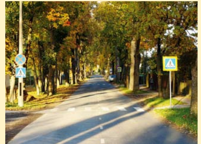
... ja nüüd.

Saue Linna Lastekaitse Ühing koostöös Saue Linnavalitsusega on viimasel viiel aastal korraldanud Saue-teemalise fotovõistluse, mille paremad pildid trükiti ära linna kalendris.