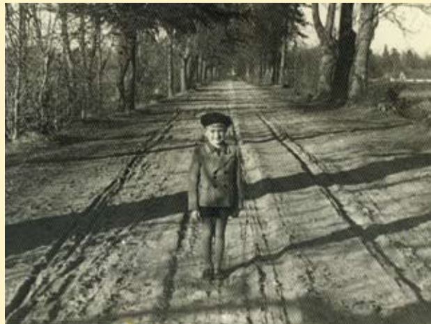
Pärnasalu tänav enne...