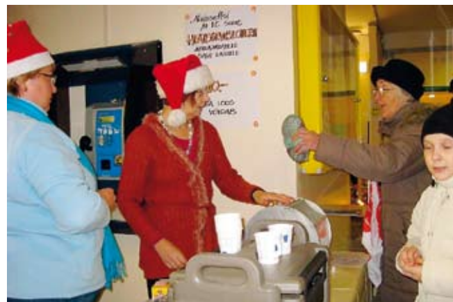
Saue Naisseltsi ja LC Saue heategevusloterii!

Pühapäeval, 14. detsembril toimus Saue Gümnaasiumis esimene Saue Naisseltsi ja LC Saue (Lõviklubi) korraldatud jõululaad. Laadal osales 23 erinevat firmat ja üksikette-