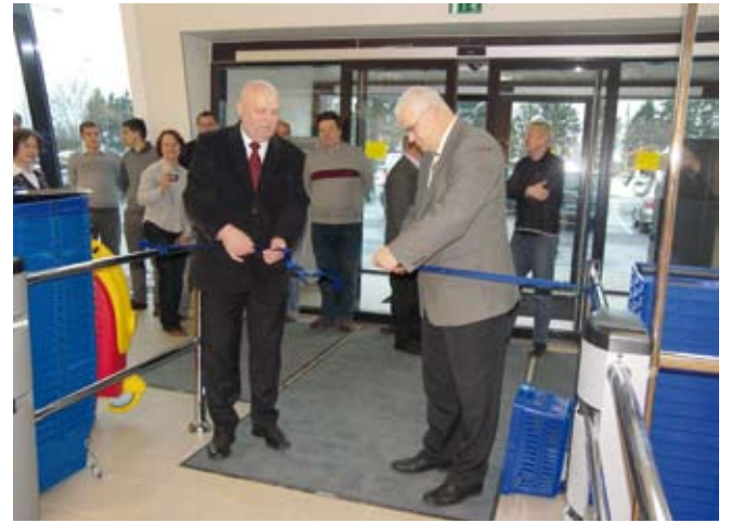
Novembri lõpus avati pidulikult uus kaubakeskus, mis läks maksma üle 26 miljoni krooni.

inimeste hinnangu uuenenud Saue Kaubakeskusele edasi kaubakeskuse avamispäeval kuulnud lause, kui üks naine ütles oma mehele: „Mõttele, kallis, milline pood meil nüüd on!“