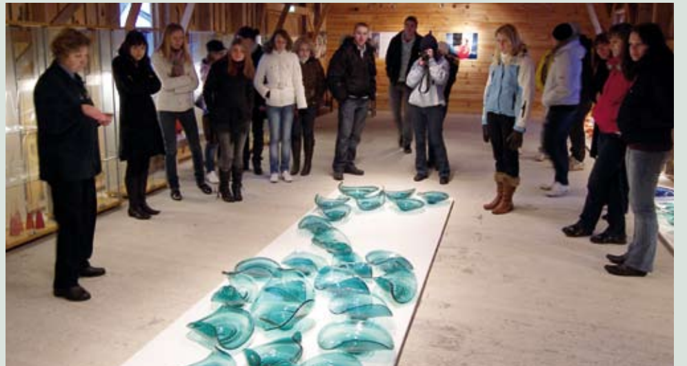
Keskkonnateadlikkuse päev Järvakandi klaasivabrikus.