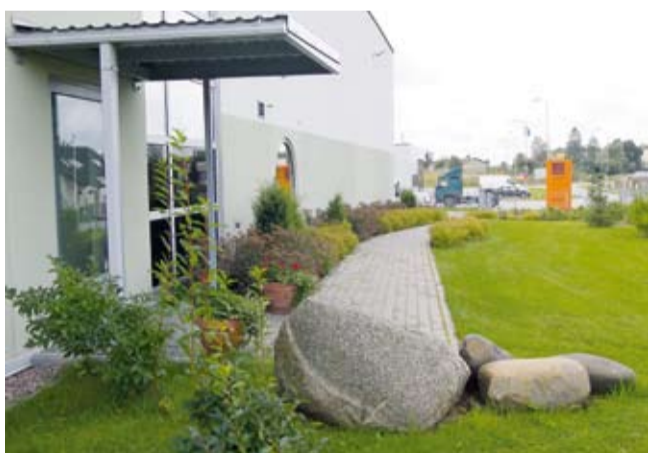
Ettevõtete kategooria võitja Zoovetvaru territoorium.