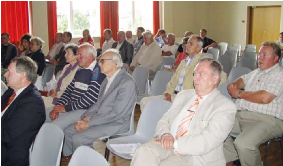
Kuulajaskonna on lummanud järjekordne esineja.

Idee sai alguse 2007. aasta korraldajate sõnaga Haapsalu Framare Spa's. SEL'i juhatuse ajurünnakul käidi välja mõtte tutvustada Saue linna elanikele neid aegu, mil erategevust Saue hakkas alles tekkima. Ja mis on tänaseks päevaks saanud esimestest firmadest? Kõige sobilikumaks ajaks arvati olevat just augustikuine Saue linna sünnipäeva aeg.