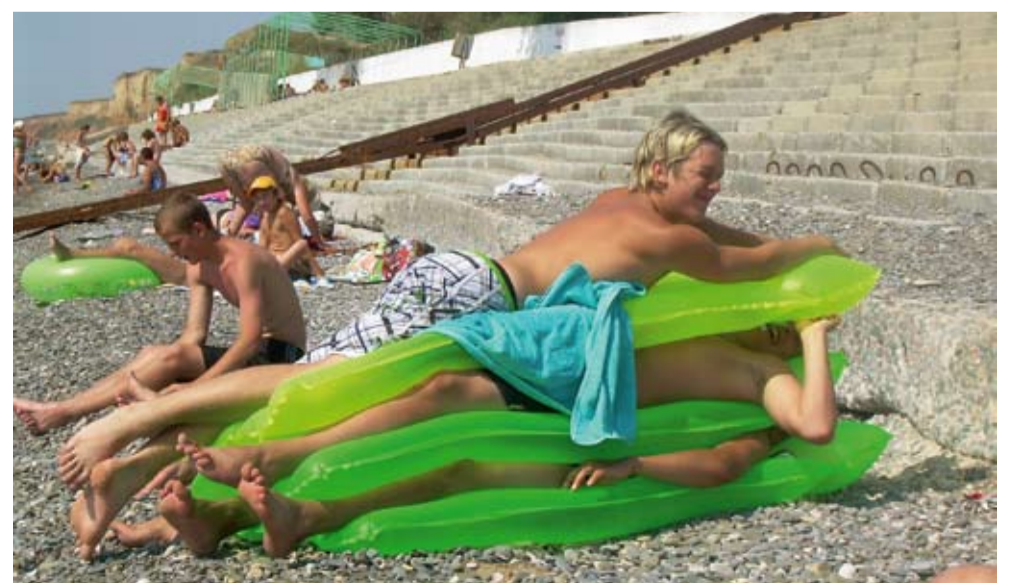
Saue poisid Musta mere ääres rannamõnuseid nautimas.