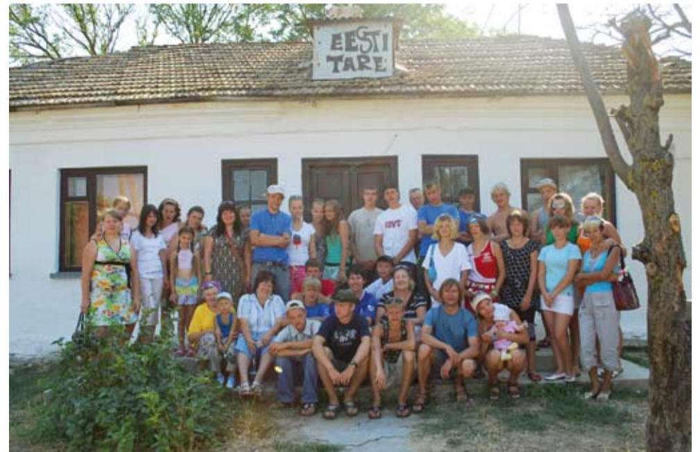
Kõik projektis osalejad Krasnodarka küla Eesti Tare ees.

See sõit aitas meil leida uusi sõpru nii maade ja merede taga kui ka siinsamas Eestis. Aitäh teile, sõbrad — teieta ei oleks reis olnud pooltki nii fantastiline, nagu see tegelikult oli! Opa-opapapa! ●