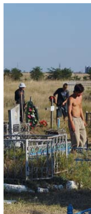
Krasnodarka küla läheduses eestlaste järeltulijate suruaeda koristamas.