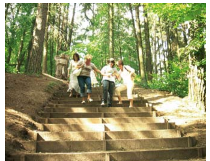
Rasked trepid Tervetel.