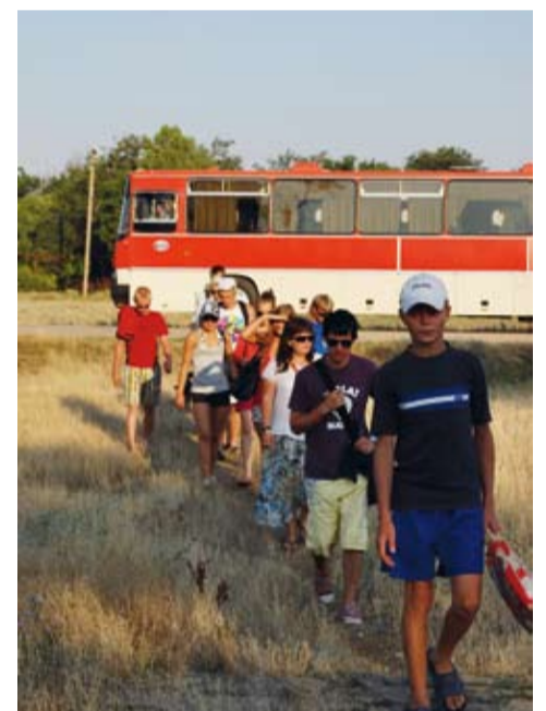
Punane Ikarus on Krimmis väga moodne.