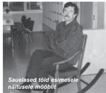
Sauelased töid esimesele näitusele mööblit