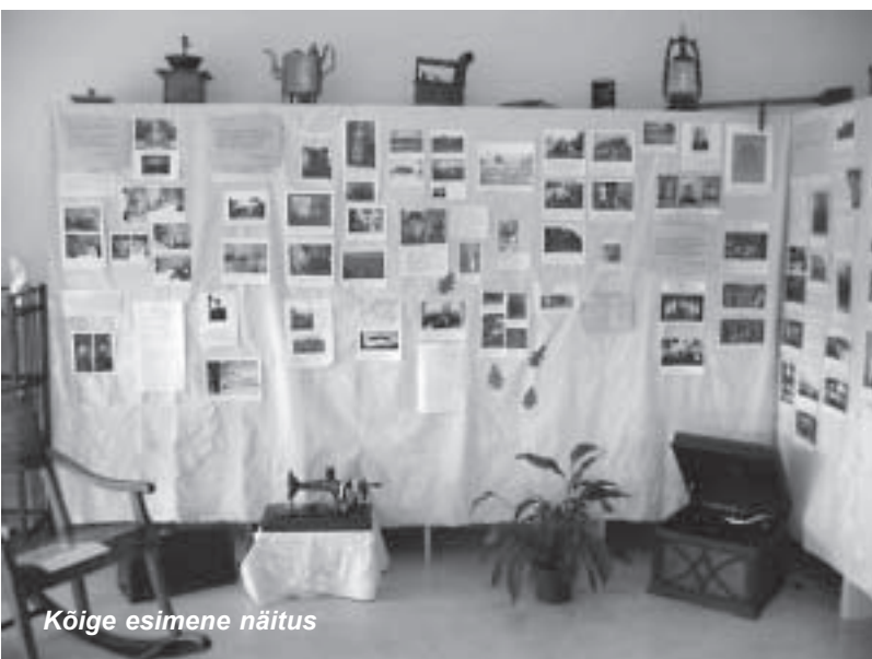
Kõige esimene näitus