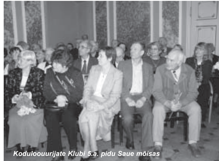
Koduloouurijate Klubi 5.a. pidu Saue mõisas

23.septembri õhtul aastal 2002 kogunes kella viieks Saue Huvikeskuse õdusasse ruumi põnev seltskond. Varasemad