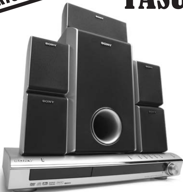
Sony DAV-DZ100 kodukino mängib ka DivX, MP3, JPG plaate, 720 W täisdigitaalne võimendi