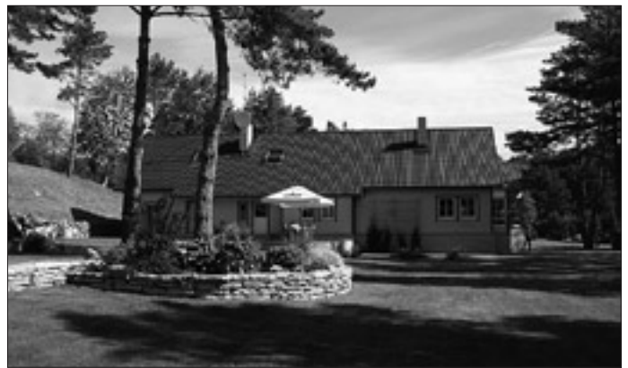
2004.a. Kauni kodu konkursil sai maakodude kategoorias II koha Lohu talu Keila vallast.