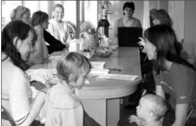
Saue emad olid huviga kuulamas perekooli asjalike lektorite-juhendajate mõttearendusi väikelaste kasvatamisest.