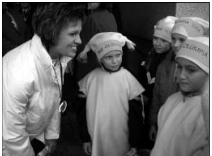
Olümpiavõitja Erika Salumäe jutustamas Saue olümpialastega.

olid põhialad veel kolmikhüpe, kaugushüpe ja kuulijänni võistlus. Erilise populaarsuse pälvis lastele mõeldud triatloni võistlus, mis algas kooli ujulas mõõduvõtmisega ujumises. Seejärel läksid võistlejad võistleva jalgrattasõidus, mille start anti vastavalt basseinis saadud tulemuste järjekorras. Jalgrattasõidule järgnes kohe jooksudistants. Arvestust peeti