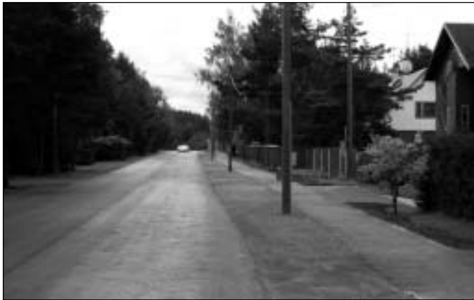
Uuendatud Tõkke tänaval saab jalakäija kõndida turvaliselt, sõidukijuhid aga nautivad aukudeta teekatet.