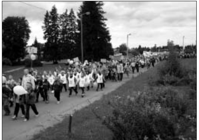
Saue II Kooliolümpiamängude avamise rongikäik läbi linna oli meeleolukas.

Pärast pidulikku avamist algasid jõukatsumised kooli spordiväljakul, kus võimalikult suurema osavõtu tagamiseks korraldati teatejooksud 8 x 250 meetri distantsil, samuti 100 jardi jooksud põhikooli viimasele klassile ja gümnaasiumi klasside õpilastele. Spordiplatsi võimalusi kasutades