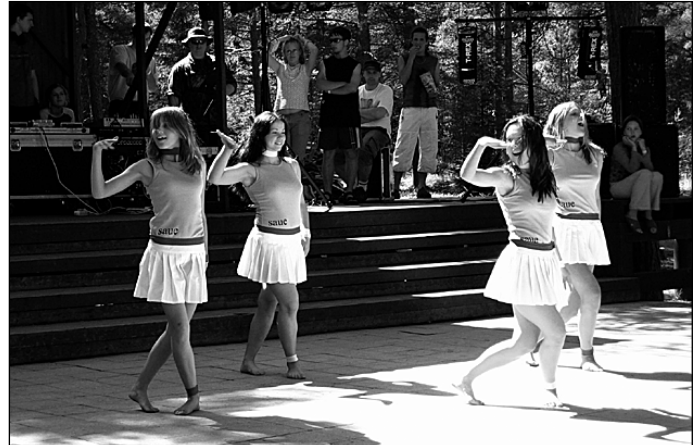
Saue tüdrukud – tantsuvõistluse võitjad – esinemas.