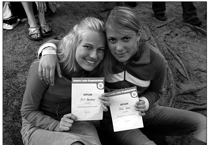
Kairit ja Kirke võitsid tänavakorvpalli.