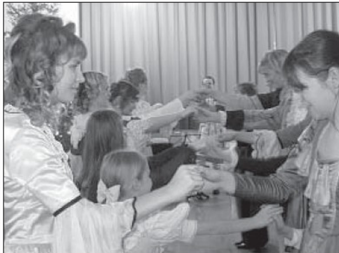
Nii saalis istujatele kui ka esinejatele tegi barokkpeo nauditavaks võimalus õppida ning proovida menuetisammu.