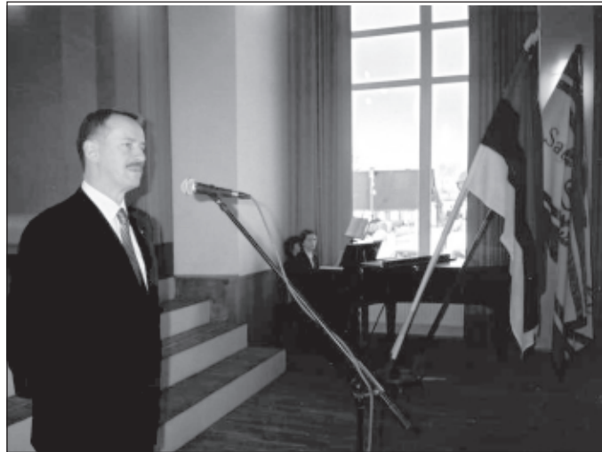
Peaminister Siim Kallas esinemas Saue Gümnaasiumi aulas, taustaks Saue linna ja kooli ning vabariigi lipud.