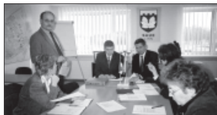
Linnavalitsus arutab maa probleeme.