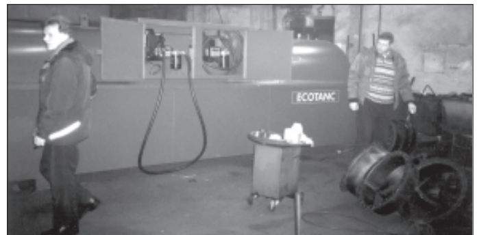
Väiketanklal on muuhulgas ületankimist vältiv seade, keskkonnasäästlik mahuti ja tavalisest kütusejaamast tuttav tankimispüstol.