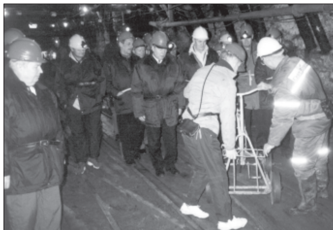
Ettevõtjad käisid kaevanduses silmaringi laiendamaks.