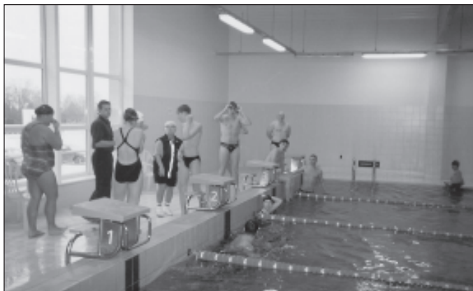
Lõpuklassi võistkonnad valmistuvad teatevõistluseks.

Ujulas on basseini mõõtmetega 11 x 25 meetrit, saunad ja pesemisruumid. Lisaks on lastebassein 3 x 6 meetrit. Kõik see ehitati 2001. aastal riigihankekongursi võitnud OÜ EKVA poolt. Ehitustööd maksid kokku 9 miljonit krooni. Projekti koostas OÜ Bikoprojekt. Täna seks on ujula töötanud enam-vähem täpselt aasta ja üldjoon-