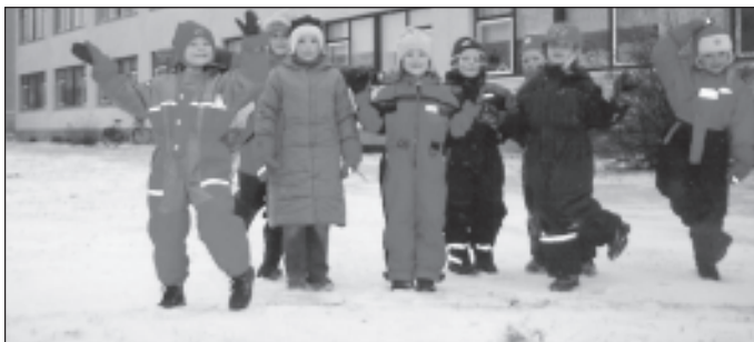
Lasteaia Midrimaa lastele tuleb Jõuluvana kindlasti, sest salmid on peaaegu õpitud.

S a u e l i n n a e a e M i d r i m a a j a a j a