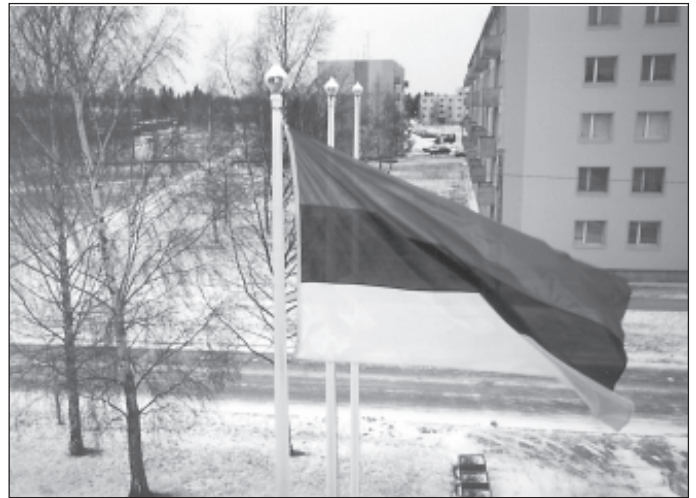
Sauel lehvib sini-must-valge lipp Linnavalitsuse hoone ees.