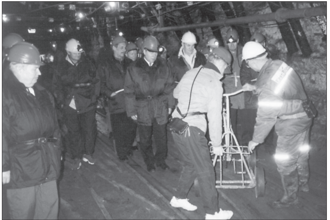
Saue ettevõtjad käisid Kohtla-Nõmme kaevanduses tutvumas kaevurielu argipäevaga.

Ettevõtjate liidu koosolek on traditsiooniliselt korraldatud Toilas. Põhjus on lihtne – ettevõtjate töö on pingeline ja oma organisatsiooni tegevuse arutamist saab edukalt teha koos sanatooriumi lõõgastavate mõnudega. Väljasõit Sauele toimus ühiselt bussiga ja Toilas arutati kohe saabumise järel koosoleku päevakorra erinevaid punkte. Üks tähtsamaid küsimusi oligi uue juhatuse valimine ja see kinnitati üksmeelselt