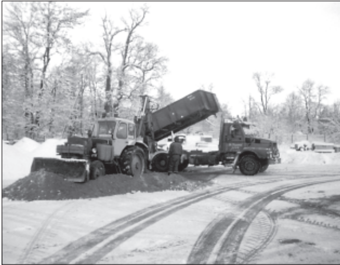
Saumeri masinad valmistavad soolaliiva segu.