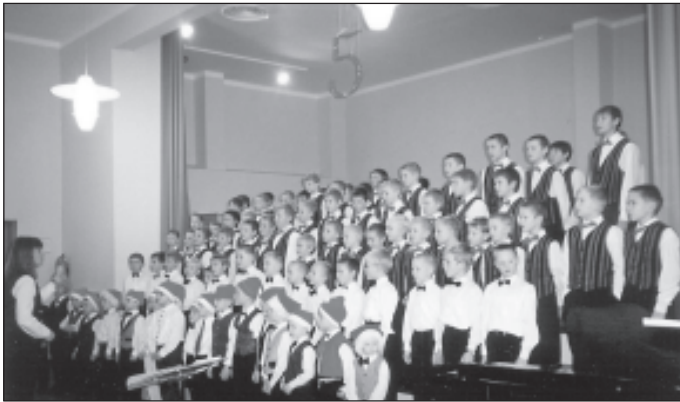
Saue Poistekoori ühendkoor esitamas Vana sõjamehelaulu Vive la compagnie.