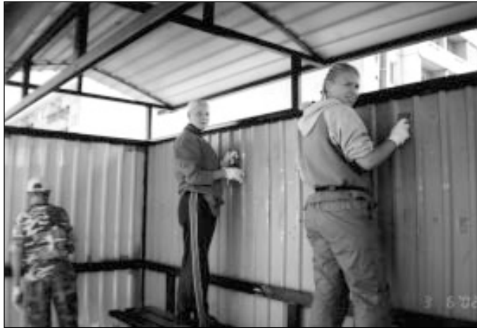
Usinad malevlased bussiootepaviljoni vuntsimas.

Paralleelselt noortepäeva ettevalmistustega käivitasime ka noorsooprojekti "Saue - puhas ja kodune linn". Projekt toetas üht Saue linna olulist ülesannet - uut jäätmekäitluskava. Et