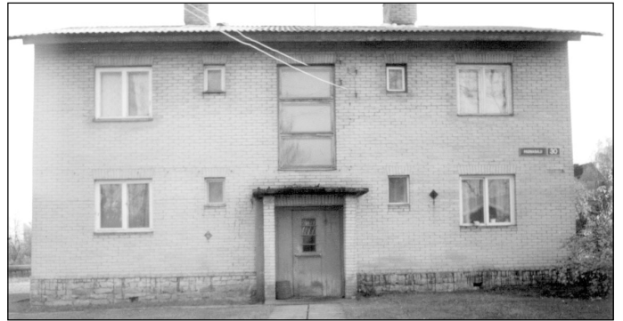
Saue lasteaia esimene asukoht Pärnasalu tänaval.

Rai-rai-ridiraa, see ongi Midrimaa, kus laps võib Rõõmsalt mängida ja laulda ka. Rai-rai-ridiraa, see ongi Midrimaa, kus laps võib Julgelt mängida ja laulda ka.