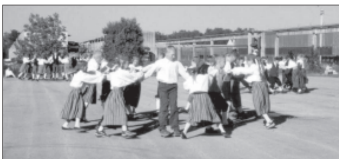
Mees tugev kui mastipuu. Hetk rahvatantsupeolt.

Meie kodulinn Saue on väike ja pealinnalähedane asukoht teeb siinse kultuurielu korraldamise keerukaks. Lähedalasuvad arvukad teatrid oma professionaalsete tegijatega, samuti kontserdid pakuvad vaatajaile kunstielamusi, milleni taidlejad kunagi ei küüni. Seepärast tulebki leida midagi niisugust, mis võrdlust välja kannataks, oleks oma ja ehtne.