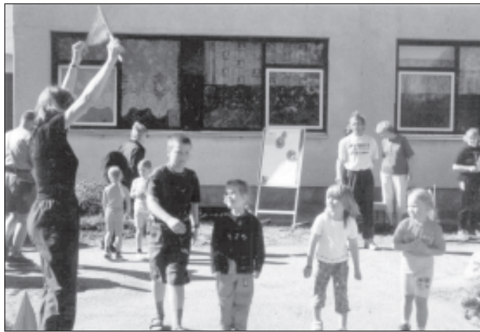
Tähelepanu! Valmis olla! Läks!

Häälekate kaasaalamist kostis isade ja poiste vaheliselt jalgpallimängult, mille võitsid seekord isad, mis aga ei heidutunud väikesi jalgpallureid sugugi. Uue pallimängu liigi, midripalli, seis jäi emade ja tü-