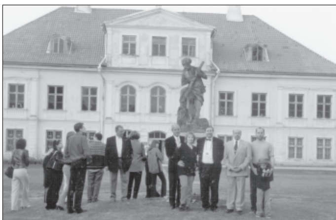
Külalised mõisa imetlemas.