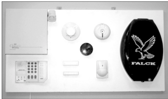
Tehnilise valve seadmed. Ülal: keskseade, sisesireen, suitsuandur, klaasipurunemisandur. All: sörmistik, magnetkontakt, vilkur, infrapunaandur, välisireen.

Statistika näitab, et enamus sissemurdmisi korteritesse sooritatakse ukse kaudu. Oma kodule turvaust valides eelistage tuntud firmasid, mis kasutavad ustel kvaliteetlukke.