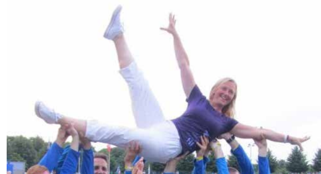
Siin on meie õpetaja. Ausalt, maailma parim. Temaga juba igav ei hakka.

Nüüd siis peamine. Meie rõõmsasse punkti oled oodatud kohe. Juba ootame kõnet telefonil 507 8758.