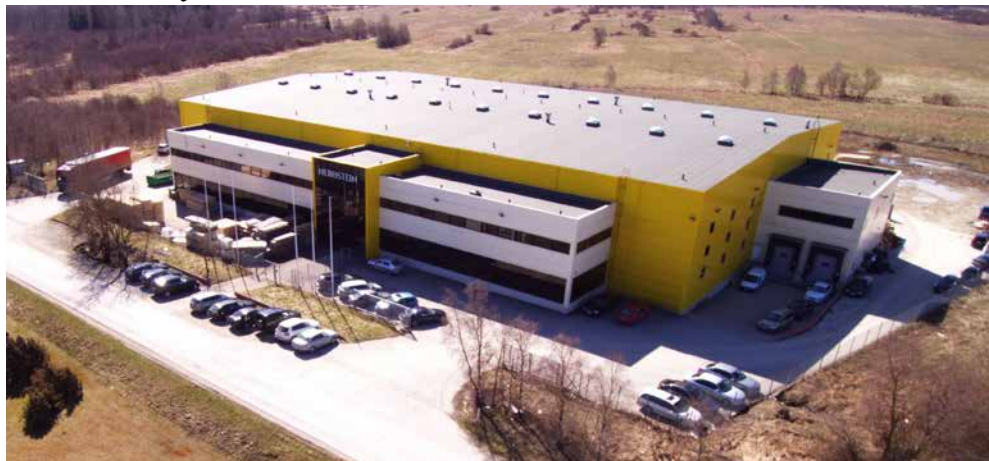
Hüüru kandi suuruselt teine tööandja Nerostein OÜ tegutseb Vatsla külas, annab tööd ligi sajale töötajale ja toodab looduslikust kivist töötasapindu

Üks kant, millest kindlasti ei saa mööda minna, on Hüüru kant. See on koduks mitmele edukale ja tuntud ettevõttele.