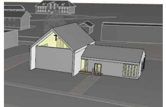
EELK kirik on plaanitud ehitada kinnistu Tule tänava poolsesse ossa, kõrvale jääb Mööbliait. Hoonele on juurdepääs ka Pärnasalu tänavalt.

EELK näeb, et kiriku ja kogudusemaja üldpindala oleks 220-300 m 2 . Mitmeotstarbeline, ligikaudu 120-kohaline kirikusaal leiaks kasutust ka linna