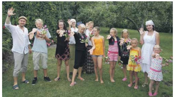
Maakodus on just etendunud näitemäng „Nukitsamees“. See on tore traditsioon igal suvel ühe etendusega üles astuda. Kaasa löövad lapsed, lapselapsed, sugulased ja nende lapsed, sõbradki.