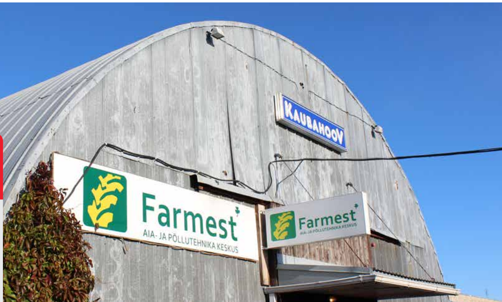
Fotod: Sirje Piirsoo

Keskuse 1, Saue linn Avatud E-R kell 9-18; L kell 9-16, P suletud Telefon 5699 6470 E-posti aadress: saue@farmest.ee