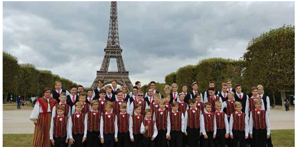
Lõpuks kauaoodatud Eiffeli torni juures.

Pargikontserti Eiffeli juures alustas äärmiselt huvitav Saksamaa akordioniorkester, kes esitas mõnegi tuttava loo omas võtmes. Palju elevust laulupoiste ja noormeeste hulgas tekitasid aga Bulgaaria tüdrukud, kelle lõbusad ja kaasakiskuvad laulud nii mõnegi noormehe tormiliselt kaasa