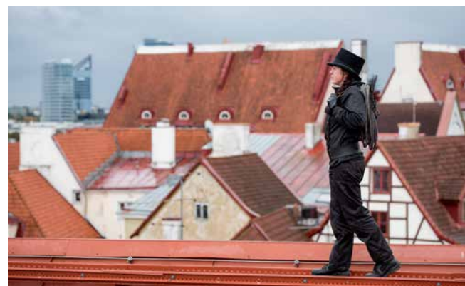
Foto: Kristiina Vennikas, ainus naiskorstnapühkija Tallinnas, võimalik, et kogu Eestis.

Enne kütteperioodi algust ei pea mitte ainult korstnat pühkima, vaid kogu küttesüsteem tuleb