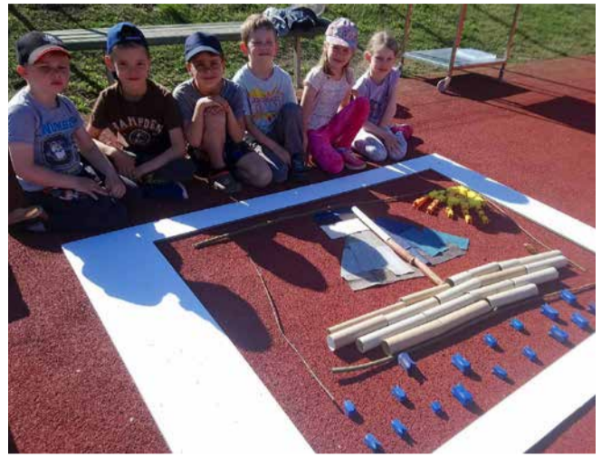
Nädala lõpetas tegevuskustega õuesõppepäev.

Sõbralikus koostöös lastevanematega on tulemas traditsiooniline 1. juuni lastekaitsepäev lemmikloomadega. Sündmust toetavad hea-parema Forum Cinemas AS ja Santa Maria AS.