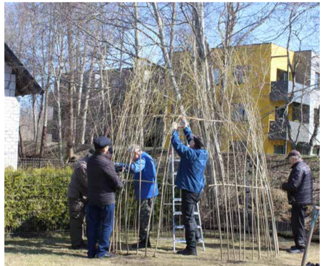
MTÜ Laagri Taadid püstitas hoovile kauaoodatud pajuviitsaoni.