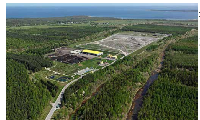
Tallinna jäätmete taaskasutuskeskus

riumitel võivad olla üsna pikad (kuni 2 km). Seetõttu pange jalga madalad, mugavad ja kinnised jalanõud ning riietuge vastavalt ilmastikule.