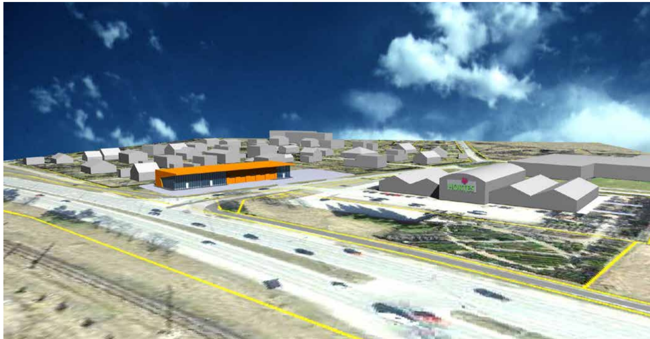
Pärnu mnt 495 kinnistule planeeritav ärihoone

oli uurida, kas ja kuidas planeeritav ärihoone leevendab Tallinn-Pärnu-Ikla teel liikuvate sõidukite põhjustatud müra planeeringualast põhja- ja ida-kirde poole jäävatele elamukruntidele. Uuringu kohaselt võib planeeritav ärihoone vähendada liiklusest tingitud müratasemeid lähimatel naaberhoonetel Viljaku (10, 11, 12, 13) ja Kivistiku (5, 6, 7, 8) tänavate ääres kuni 5 dB võrra.