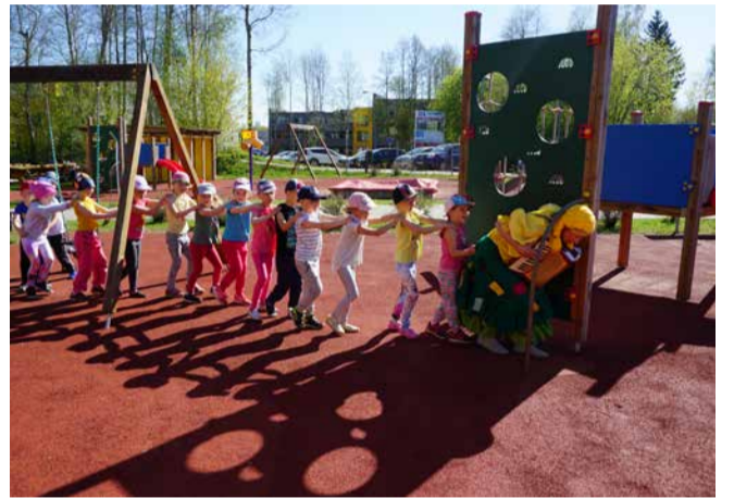
Rõõmsameelne Päiksepliks trallis lastega hoovialal akordionit mängides ringi.