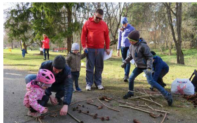
Mis veel puudu on? Jüriöö nutijooksukesel osalejad pilti täiendamas.