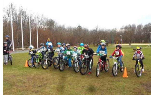
Stardis on poisid