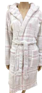
Naiste hommikumantel MASQ