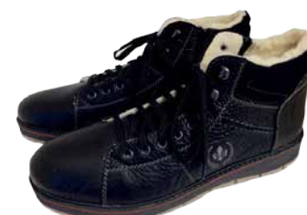
Meeste saapad Rieker