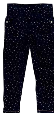
Tüdrukute püksid Lemon Beret