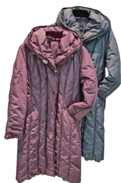
Naiste mantel Flare