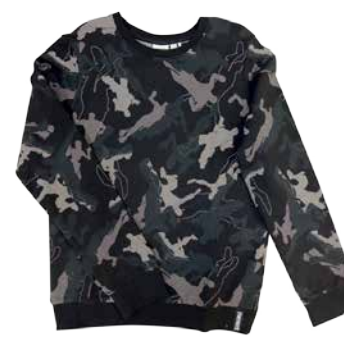
Laste dressipluus Name it Fortnite