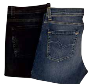
24.-26. jaanuar meeste ja naiste teksapüksid