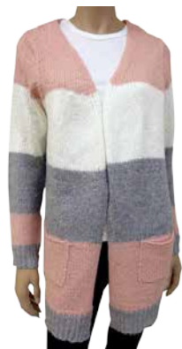
Naiste kardigan Hailys