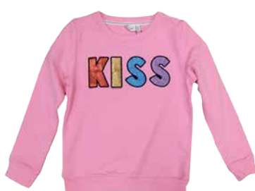
Tüdrukute plus Name it