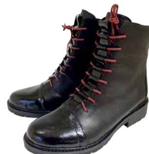
Naiste saapad Remonte