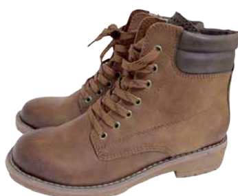
Naiste saapad Marco Tozzi