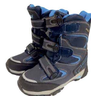
Laste saapad Peddy