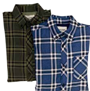
Meeste päevasärk Jack&Jones