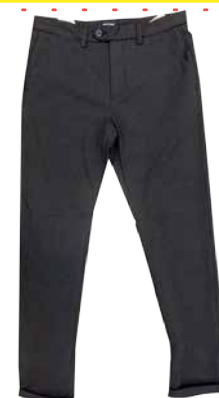
Meeste püksid Jack&Jones