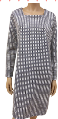
Naiste kleit Blue Seven