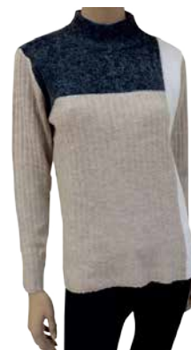
Naiste kudum Fransa