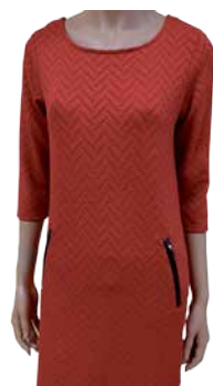
Naiste kleit Fransa (punane ja must)