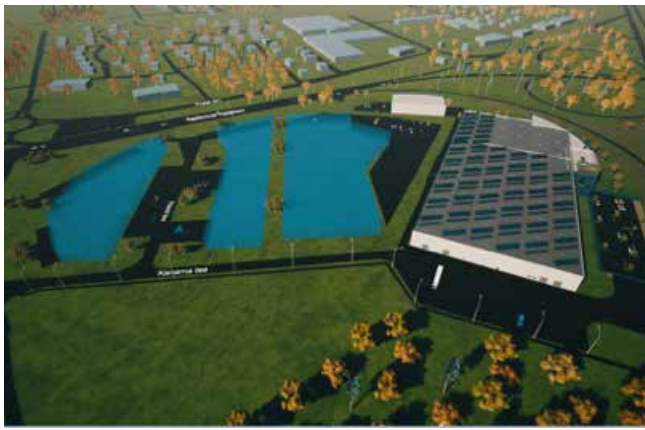
Jõgisoo külas Klaasi, Keila mnt 3 ja Kanama tee L1 kinnistute planeeringuala (sinisega) koos naaberkiinnistule (Kurvi, Keila mnt 1 ja Kanama kergtee L1 planeeringualale) planeeritava klaasitoodete tehasega (illustreeriv joonis)

Saue Vallavalitsus kehtestas 18.12.2019. aasta korraldusega nr 1492 Jõgisoo külas Kurvi, Keila mnt 1 ja Kanama kergtee L1 kinnistute ja lähiala detailplaneeringu, eesmärgiga muuta ja uuendada kehtiva detailplaneeringuga ette nähtud maakasutus- ja ehitustingimusi, st näha ette kinnistute kruntimist, maasihtotstarbe muutmist ärimaast osaliselt tootmis- ja transpordimaaks, mille kohaselt moodustatakse kokku kolm äri-, tootmis- ja transpordimaa krunti. Ühele äri- ja tootismaa krundile määratakse ehitusõig-