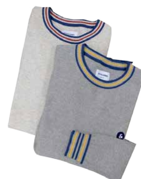
Meeste kudum Jack&Jones