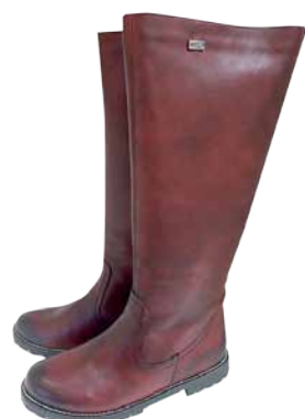
Naiste saapad Remonte