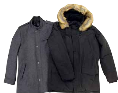
17.-19. jaanuar meeste joped ja mantlid