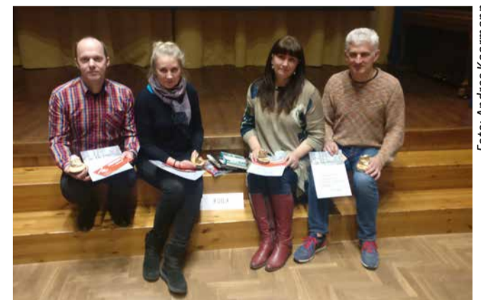
Ruila küla esindus.

Mõned nädalad varem lõppes Kernu külade traditsiooniline mälumängusari.