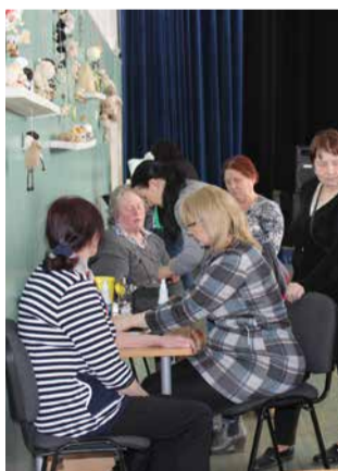
Kõik soovijad said mõõta vererõhku ja veresuhkrut

Tervise teabepäeval osalejate hulk oli muljetäratav