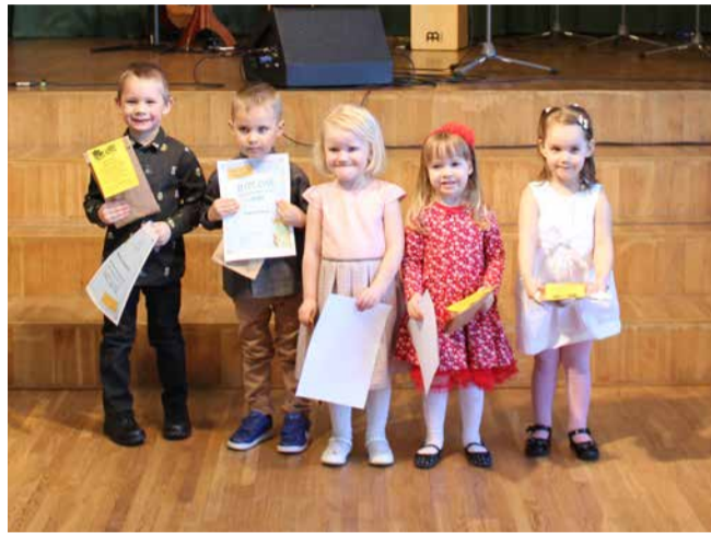
Kõige väiksemad laululapsed