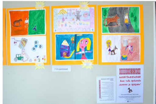
Kunstikonkursil „Kirivöö ja kiikhobu“ osales 61 õpilast 60 tööga