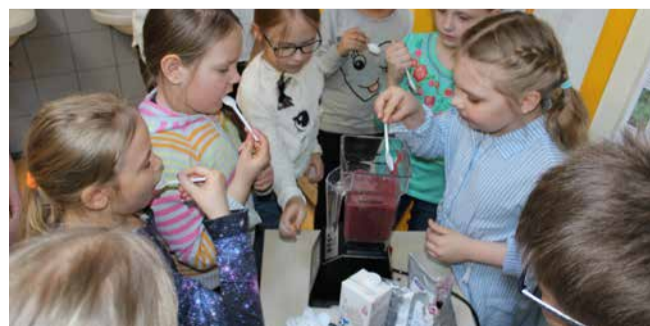
Kas tuli ka hea?

lida, mida ja kui palju smuutisse panna ehk vabad käed ja vaba lähenemise retseptidele.