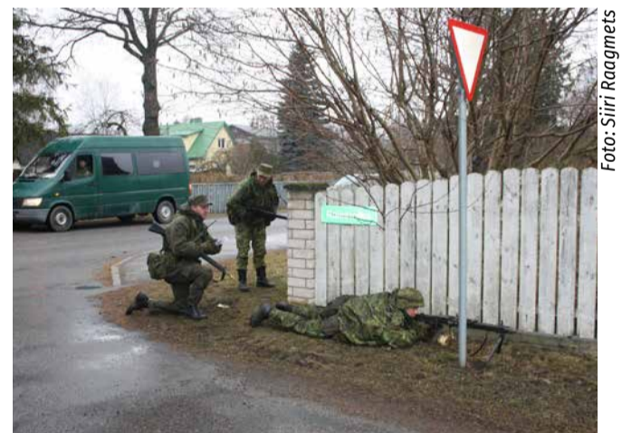
Fotomeenus Kaitseliidu õppusest Saue linnas 2014. aastal.

Saue linnas ja Saku alevikus viib Kaitseliit läbi patrulloperatsiooni 5. mail kell 10-16. Õppusel Siil osalevad kaitseliitlased kasutavad vaid imitatsioonivahendeid