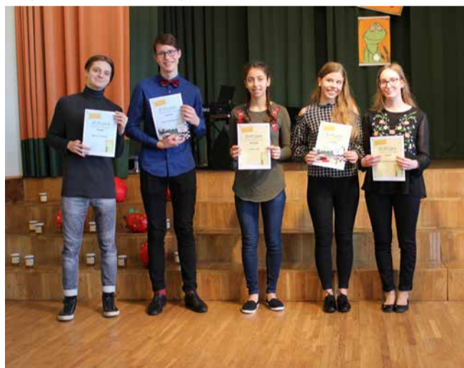
Kõige suuremad laululapsed