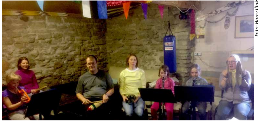
A-Studio kaasab vanemad pilliõppesse

Hea ansamblijuhataja tajub oma rolli meeskonnas, tunneb täit vastutust talle