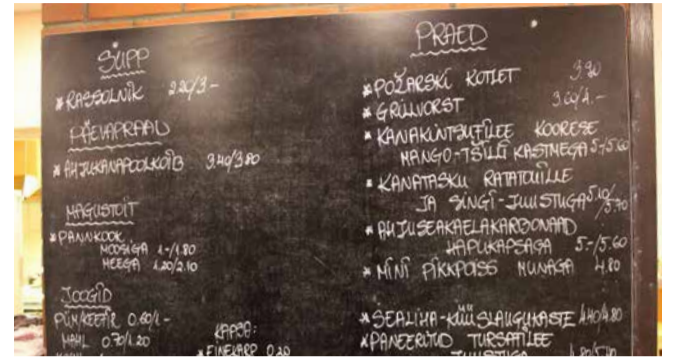
Suppi ja praadi, kooki ja moosi, sulelisi, karvaseid ja uimedega

Testija C: Požarski kotlet ja vesi, hind 5,10 eurot „Üldiselt maitsev kodune toit. Keedukartul oli meel- diva maitsega, parajalt kee- detud, ei olnud liiga kõva ega pudenenud ka laiali. Li- sandiks pakutud toorsalatid olid samuti maitvad: riivi- tud toores peet, maitsesta- tud köömnetega ja värsked kapsa - värsked kurgi salat. Kotlet oli krõbe, ent oleks võinud olla mahlakam. Mis puutub minu toidueelistust,