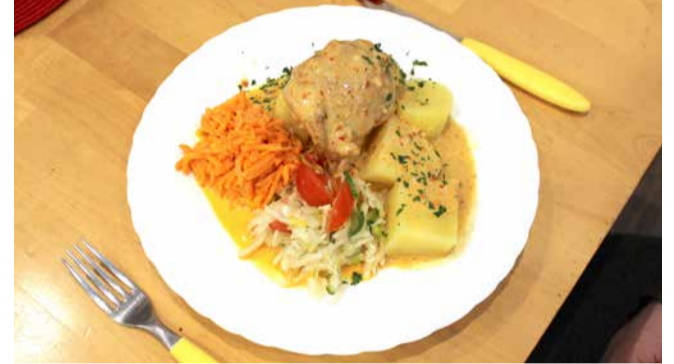
Kanakintsufilee mango-tšilli kastmega