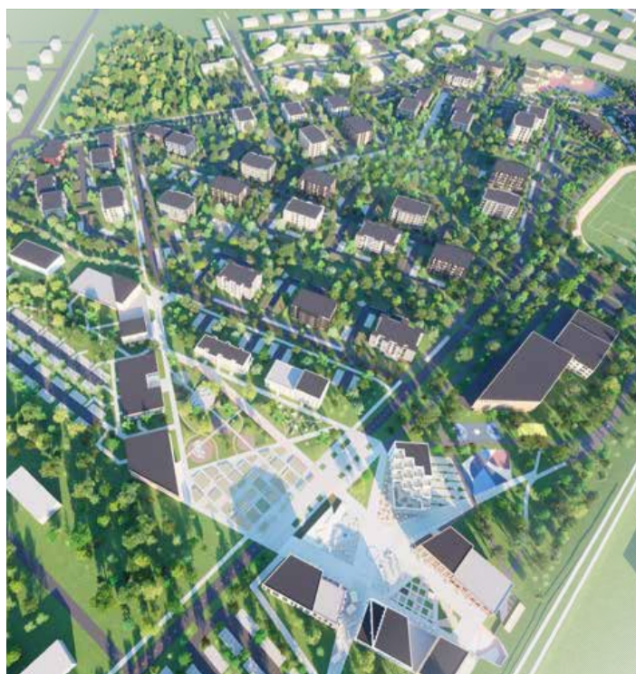
Roheväljak, vaade lõuna suunas.

Uus Saue keskus Olemasolev peatänav Saue Kaubakeskus Olemasolev Saue keskuse park Saue vallavalitsus Olemasolev rongipeatuse asukoht