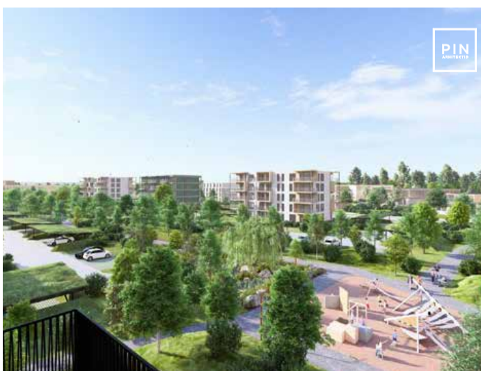
Vaade kortermajade vahelt

Olemasoleva Saue keskuse telje moodustab Kütise tänav koos kaupluse, pargi ja vallamajaga. Planeeringus pikendatakse sama telge üle raudtee, kus see moodustub uue keskväljaku koos kultuurimaja, tervisekeskuse, büroohoonete ja äridega. Avalikud ja ärihooned on kavandatud ka ristuvale teljele, paralleelselt raudteega, kus asuvad kauplus ja kool. Lasteaed on viidud planeeringuala keskele poole, et tagada turvalisus ja kasutus mugavus. Uue keskuse elavdamist toetab olemasolev rongipeatus.