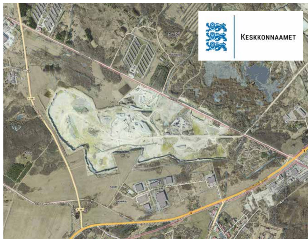
Taotletav mäeeraldis asub Harjumaal Saue vallas Hüüru külas Harku karjäär 3, 4, 7, 8, 9, 10, 11 kinnistutel.