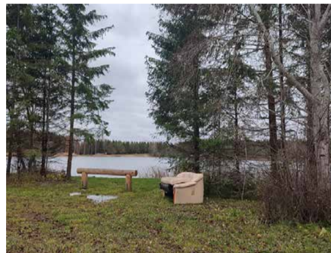
Diivan Maidla Järve ääres.

Toetuse väljamaksmise eritingimus. Toetust ei maksta ettemaksuna! Toetus makstakse välja alles pärast tegevuste täielikku elluviimist, kui tegevuse eest on