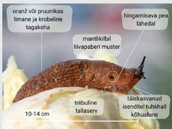
VÕÕRLIIK: HISPAANIA TEETIGU

Tavalised elupaigad on topsaka taimestikuga alad, rohumaad, pargid ja niisked laialehised metsad, ka kasvuhooned. Teod liiguvad enamasti hämarikus ja öösi, vihmastel perioodidel ka päeval. Soojadel talvedel ja heade varjevõimaluste korral talvituvad Eestis edukalt.