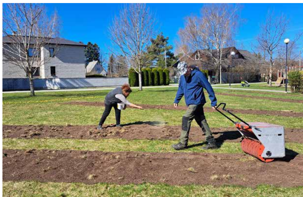
Lilleseemnete külv Saue linnas Keskuse pargis ning Vana-Keila maantee ja Pärnasalu tänava niitmata kolmnurgal.

koosnevad ainult kodumaise looduslike niidutaimede liigiti kogutud seemnetest. Dekoratiivsuse suurendamiseks rajamisaastal sisaldab segu üheaastaste liikide seemneid.