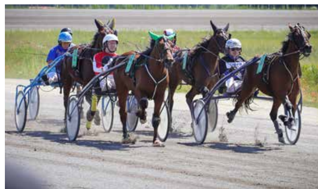
Fotomeenus American Horse Showlt.

Tuula tutulus on 71-millimeetrise läbimõõduga kuhikukujuline naast, kõrge torn keskel, tagaküljel kinnitusaas. Kuju ja ornamentika põhjal on Tuula tutulus dateeritud Põhjala pronksiaja neljandasse perioodi ehk ligikaudu ajavahemikku 1100–900 eKr.