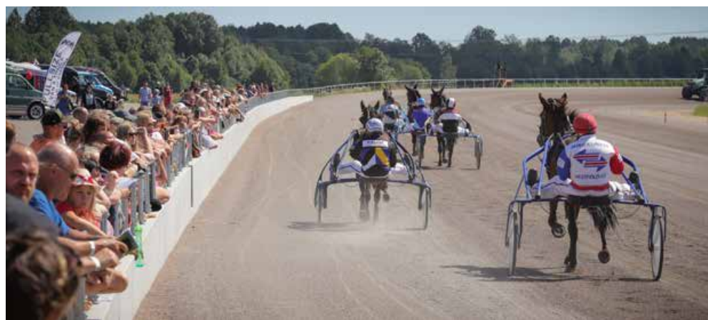
Tippkiirus rajal on ligi 60 kilomeetrit tunnis.

Tänavu algab Tuulas tallide ehitus. Uues tallikompleksis on kohti sajakonnale hobusele, lisaks väliboksid. Treenerid on kümnekond. Kui tulevad hobused, on võimalik, et hipodroomil on