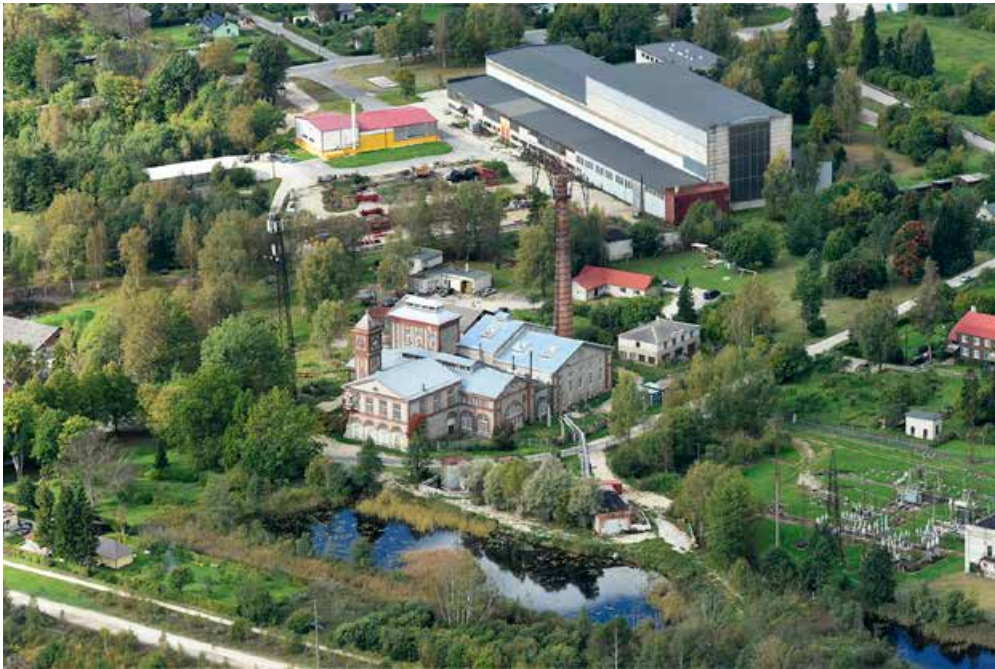
Ellamaa elektrijaama ümbrus 2018. aastal.

Turbatööstus hakkas 1971. aastal kandma nime TK Tootsi Ellamaa jaoskond, kuna allutati Tootsi Tootmiskoondisele, ning ehitas kahe- ja kolmekordseid korterelamuid.