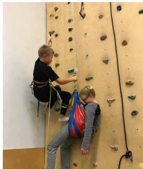
Kannatanuga koos üles ronimine

Me jätkame tase kõrgemal: haaratsiga ronimine ja kaheksaga laskumine, tõus