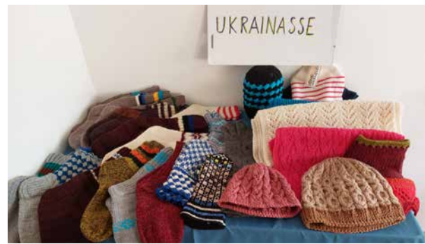
Sokid, kindad, mütsid, mis ootavad Ukrainasse saatmist. See laud täieneb pidevalt uute soojade esemetega.