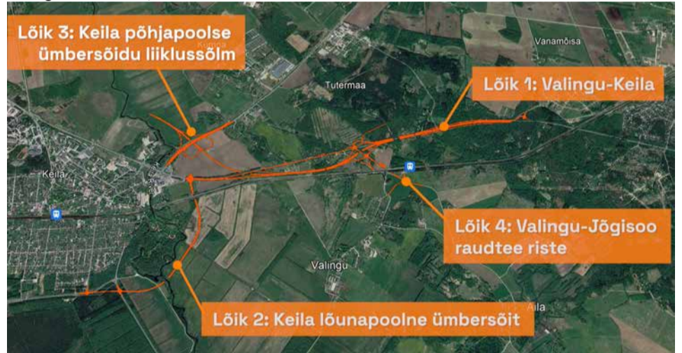
Iga lõiku neljast saab välja ehitada eraldiseisvalt.

parallelselt Keila jõega kuni kokkuvõimiseni Keila linna Ringtee ja Ülesõidu tänavatega. Ristumisel raudteega on kavandatud kõrges muldes olev viadukt. Keila jõega ristumine on kavandatud sillana, mille alt kulgevad mõlemal jõekaldal jalgratta- ja jalgrataste ning on tagatud kalasrajad kobarastele ja saarmatele. Keila lõunapoolne ümbersõit on kavandatud keskpärase lõiguna ning kiirusrežiimile 80 km/h, lõigul on eeldada suurt raskekiikluse osakaalu.