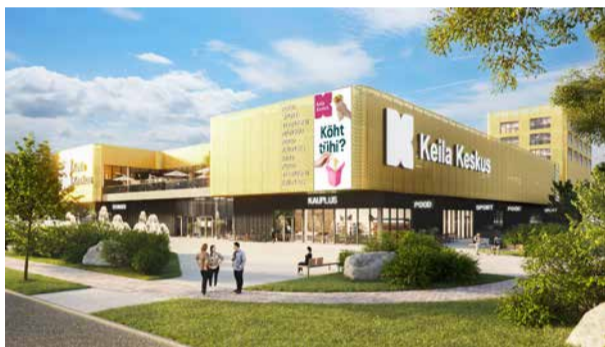
Keila kogukonna- ja meelelahutuskeskuse avamine on kavandatud 2025. aasta algusesse.