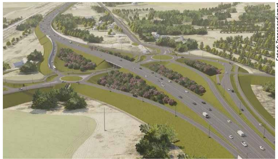
Valingu liiklussõlm, vaade Keila suunal.

Eelprojekti tasemel on lahendatud ka Keila lõunapoolne ümbersõit. Lõik algab Tallinna ringteel olemasoleva mobiilmasti piirkonnast ning kulgeb