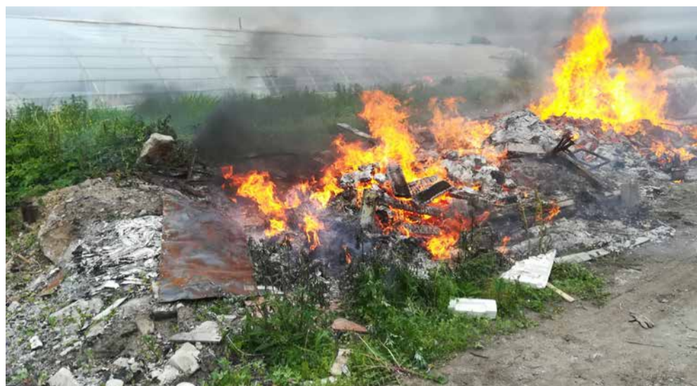
Jäätmete põletamine Sagros

Toetuse tingimused ja taotluse vormi leiab Saue valla kodulehelt http://sauevald.ee/keskkonna-valdkonna-toetused