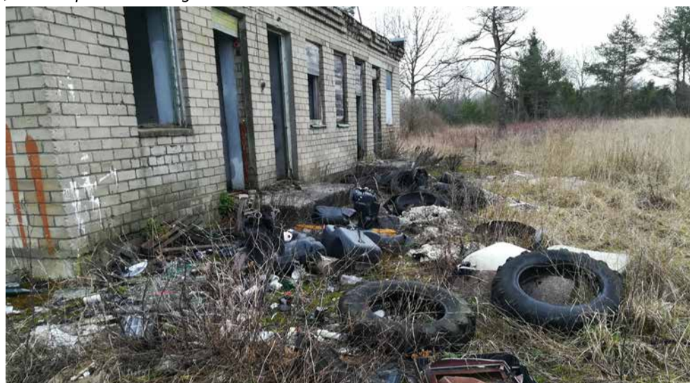
Tuula vana prügila

Toetus määrus „Keskkonnareostuse likvideerimise, heakorra tagamise ja elamistingimuste parendamise toetuse maksmise tingimused ja kord“.