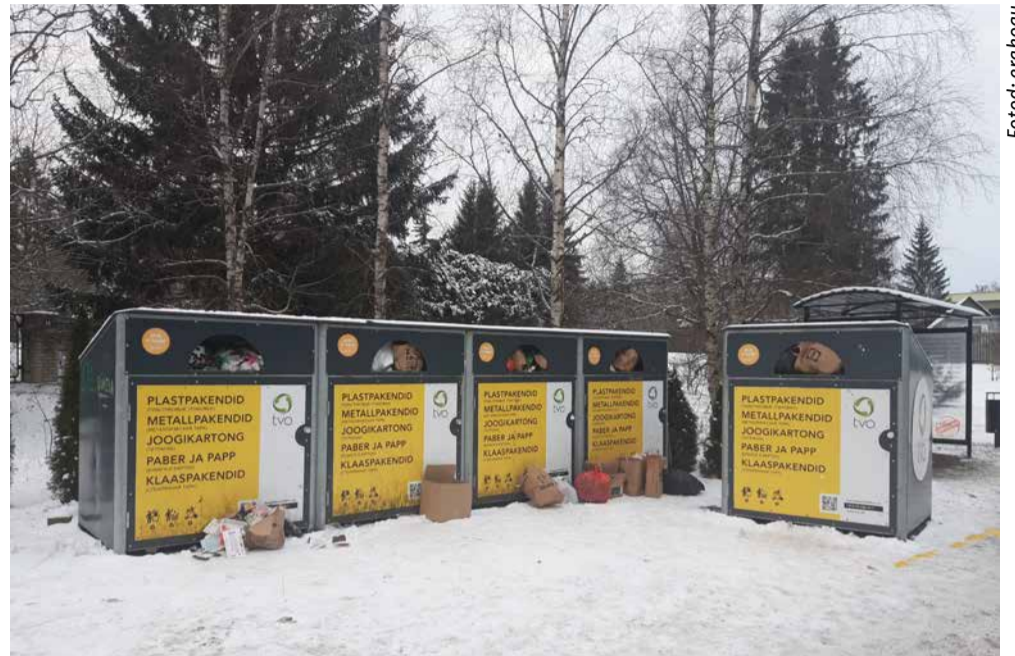
Nõlvaku tänava pakendipunkt ühel nädalavahetusel.

Nii et head inimesed, kui toote pakendeid suure kogiga, mis ilmselgelt konteineri luugist sisse ei mahu, siis nähke palun veel natuke vaeva, et see korralikult konteinerisse suruda.