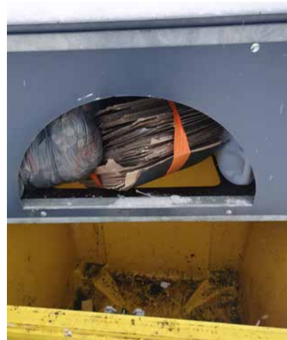
Pakendikonteineri avad ummistatud, konteinerid tühjad.

Hea uudis siinjuures on see, et aasta perspektiivis plaanib TVO majad eemaldada ja asendada mahutid uut tüüpi konteineritega.