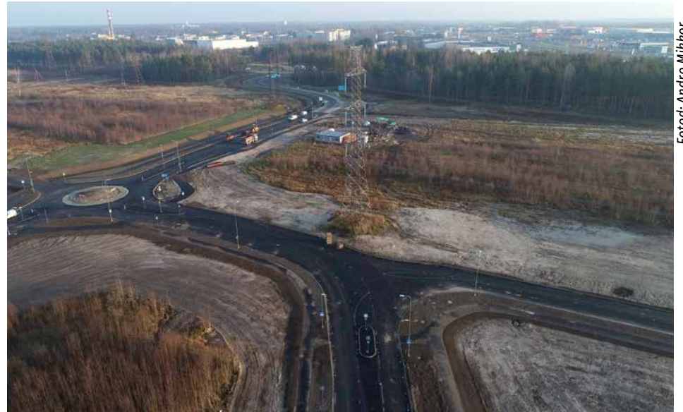
Vaade Gate Tallinn arendusalalt Laagri aleviku suunas.

Ühendustee ehitas AS YIT Eesti ja omanikujärelevalvet teostas Sweco EST OÜ.