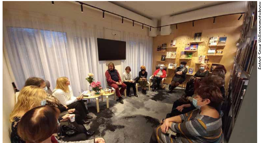
Tänu suurele huviliste hulga kujunes kohtumine äärmiselt soojaks ja sisutihedaks.

Et romaan kujutab minategelase elu kolmeaastasest kuni täisealiseks saamiseni, olen püüdnud sündmusi ja tundeid kirjeldada alul üsna lapselikult vaatevinklist lähtudes, muutudes järk-järgult väljendusrikkamaks ja hingelisemaks. Usun, et tü-