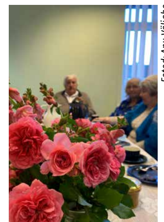
Kogudus hoolib oma inimestest. Pärast jumalateenistust õnnitletakse sünnipäevalapsi ja ollakse koos kohvilauas.

Väliaho kell 16 algaval esimese advendipüha küünla-süütamisel Saue vallamaja juures. Saue koorid esitavad jõululaulu, milles on kuulda lähenevate jõulupühade