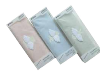
Pinal M&G Little Angel