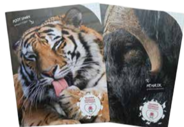
Kaustik 36 lehte