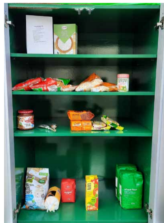
Kapist võib leida igat sorti toiduaineid.

Et toiduraiskamist vähendada, on soovitatav osta lühema tarneaehelaga kohalikku toitu, planeerida toidu tarbimist, kasutades ära olemasolevad toiduained, vaadata pidevalt üle oma varud, kontrollida regulaarselt toodete aegumiskuupäeva. See läbi on võimalik aastast toota kuni 150 kg toidujäätmeid vähem majapidamise kohta.