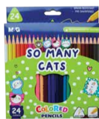
Värvipliatsid M&G 24värvi