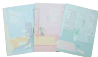
Kaustik B5 48 lehte