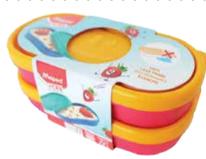
Toidukarp Maped Picnic 2tk