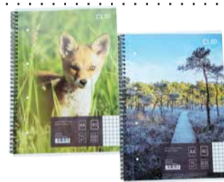
Spiraalkaustik ruuduline A4 80 lehte