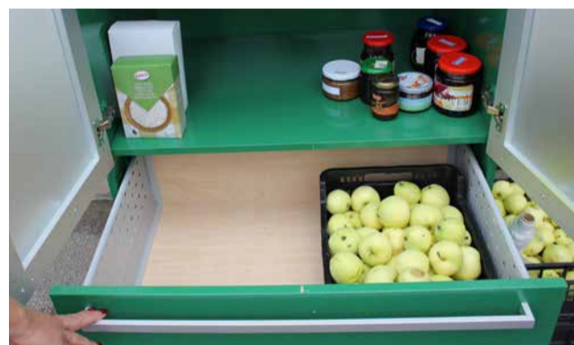
Aiasaadused jäta kapi alumistesse sahtlitesse.