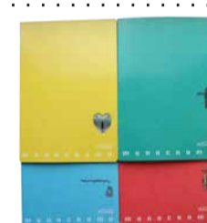
Kaustik ruuduline A4 38 lehte