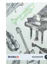
Noodivihik Bradley A5 12 lehte