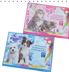
Joonistusplakk A4 20 lehte