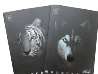
Kaustik A5 40 lehte