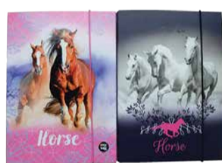
Vihikumapp hobune junior A5