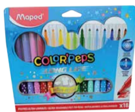
Viltpliatsid Maped Color Peps 18 värvi