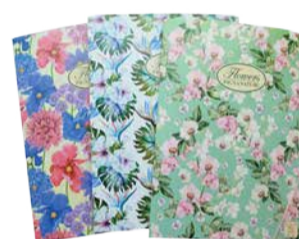
Mapp kummiga A4