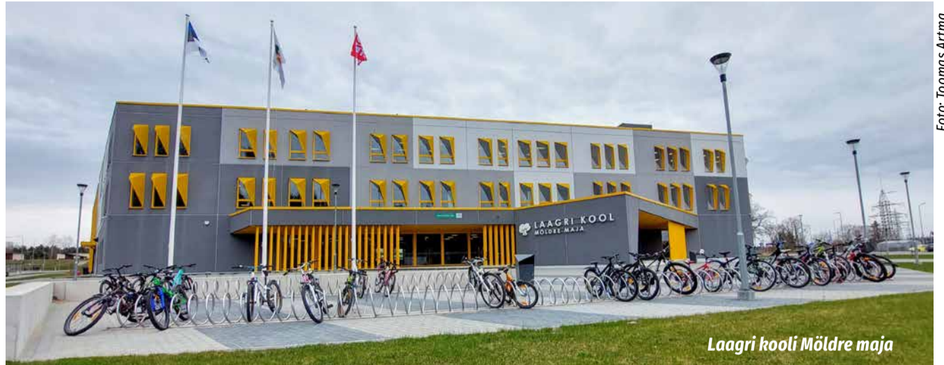
Laagri kooli Möldre maja

Samadel päevadel ja kellaaegadel on koolis koolitarvete müük. Võimalik on soetada kõike kooliks vajaminevat pliiatsitest koolikottideni. Müügil on ka õpikute ja töövihikute kilekaaned, mis on komplekteeritud vastavuses klasside õppematerjalidele. Lisainfo: 5565 1483, Kai.