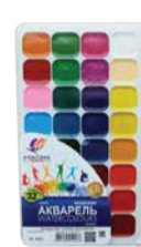
Akvarellvärvid Luch Klassika 32 värvi