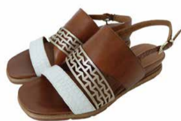
Tamaris Naiste kingad