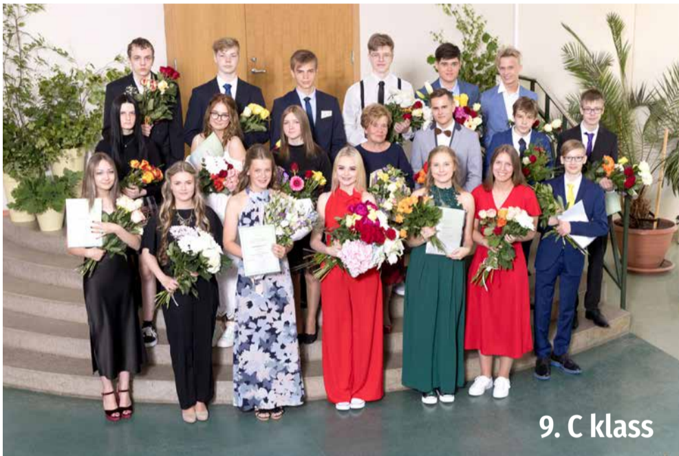
9. C klass