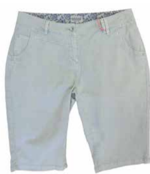
Blue Flame Naiste lühikesed püksid