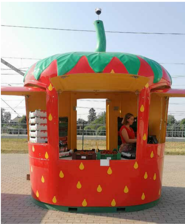
Lisaks oma värvamüügile on Raja talu kiosk püsti pandud ka Keila turul, sellest mööda vaadata ei anna, on teine sobivasti maasikakujuline