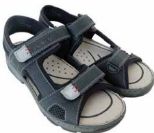
Rieker Meeste sandaalid