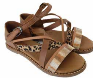
Tamaris Naiste kingad