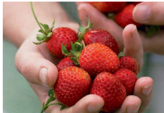
Raja talu kasvatatakse peamiselt Asia-nimelist nagu vana hea Polka, suure suhkruisaldusega, aga vastupidavam

Näiteks kogu Euroopas kasutatav marjatunnelite süsteem, kus mari tuleb käte varem ja on stabiilsem. Ka