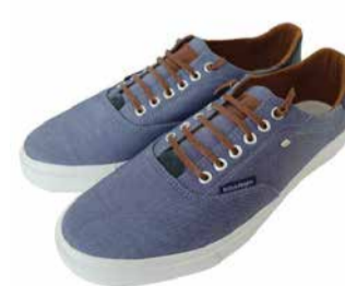
British Knights Meeste tennisid