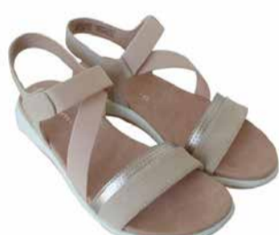
Tamaris Naiste sandaalid