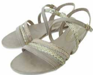
Marco Tozzi Naiste sandaalid