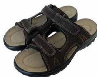
Marco Tozzi Meeste sandaalid