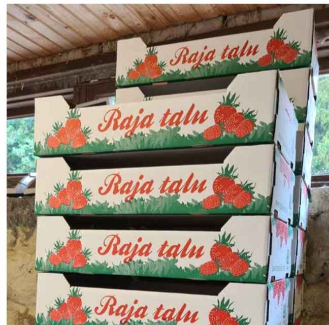
Raja talu leiab ka Facebookist - www.facebook.com/maasikad

marja korjamise aega oleks võimalik pikemaks venitada. „Kui ma oleks 30-aastane, küll siis vist veel timmiks ja jändaks,“ mõtiskleb mees.