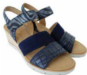
Sabor Naiste kingad