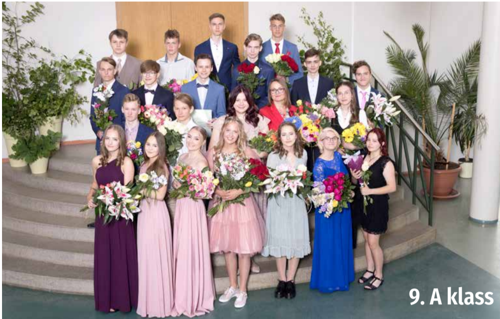
9. A klass