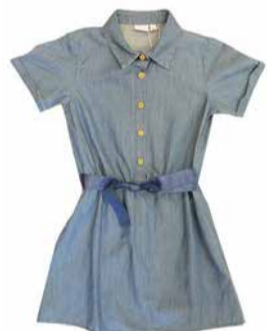
Name It Tüdrukute teksakleit