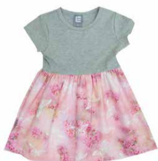
Lenne Tüdrukute kleit