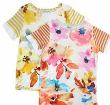
Gaia B Naiste džemper