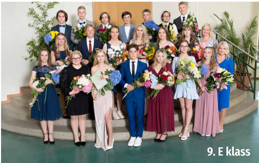
9. E klass