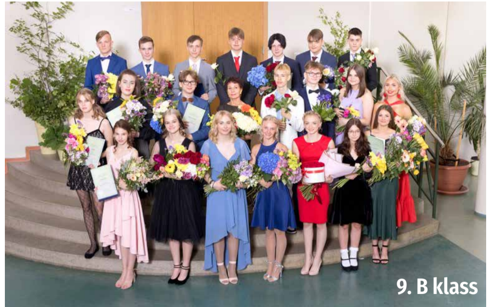
9. B klass