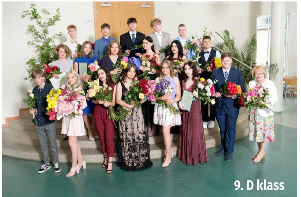
9. D klass