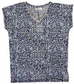
Soya Naiste džemper