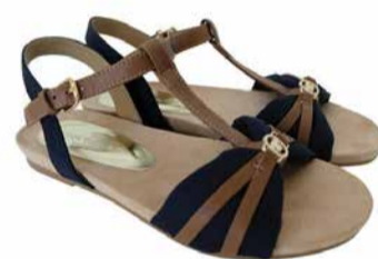
Tom Tailor Naiste sandaalid