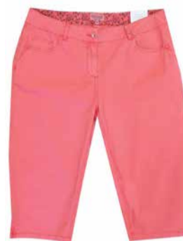
Blue Flame Naiste capri püksid