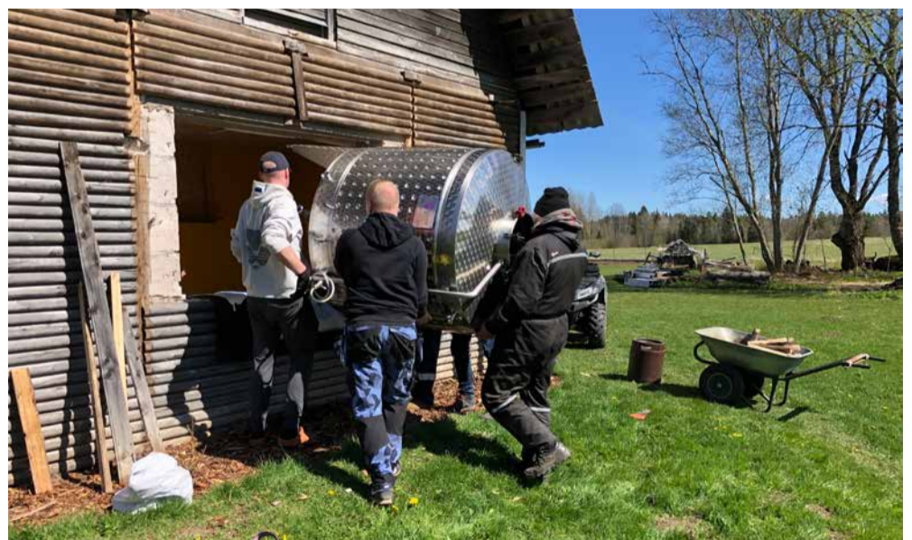
Uute seadmete kolimiseks oli vaja eest ära võtta koguni aken, survemahutit sisse tõstma tuldi appi koguni naabertaludest.

„Eelmisel aastal tootsime ca 50 hektoliitrit õlut. Uued seadmed said ka selleks soetatud, et mahtu kasvada. Paari aastaga sooviks jõuda 200 hektoliitri peale,“ räägib Kõrkjas.