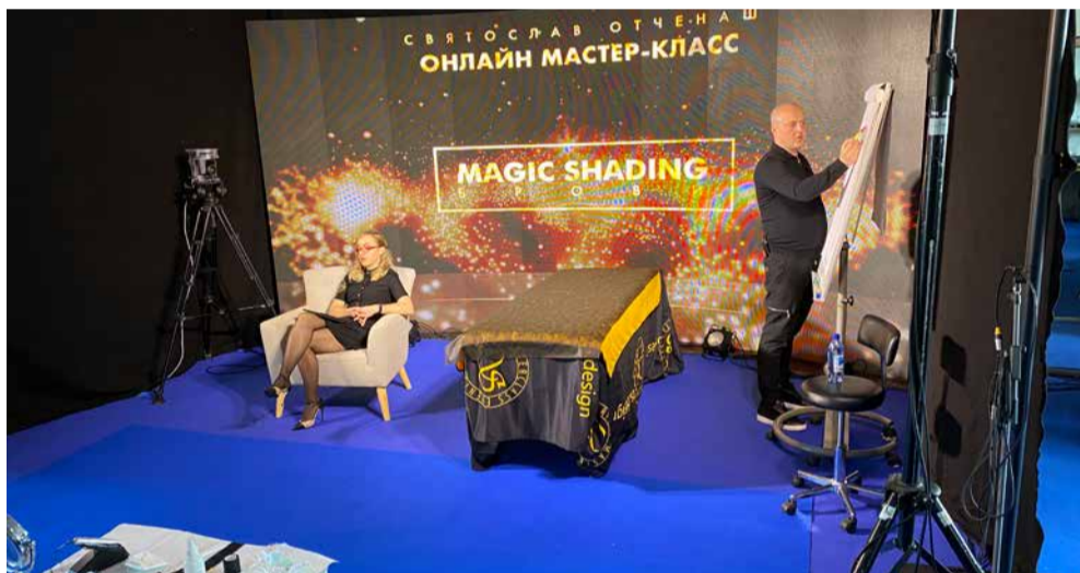
AcademyS rahvusvaheline online-koolitus püsimeigi tegemiseks.