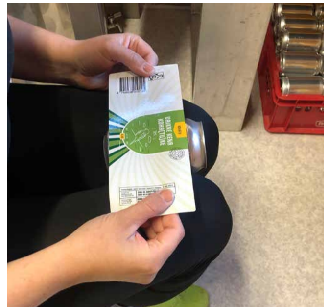
Ka sildistamine käib käsitsi. Võiks isegi öelda, et algusest lõpuni käsitöö!

EVPL-i missioon on liikmete huvide esindamine ning Eesti alkoholikultuuri arendamine läbi kõrgekvaliteediliste toodete pakkumise ja tarbijate harimise.