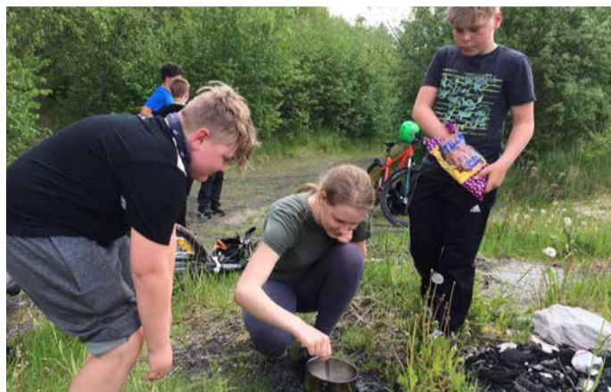
Kui ilm vähegi lubab, ollakse õues.