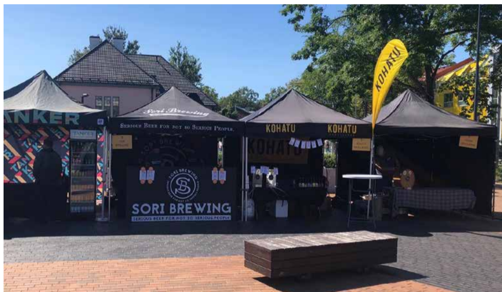
Väikepruulijate festival aastal 2019.

on, et need käsitööõlled on ju nii mõrud.“