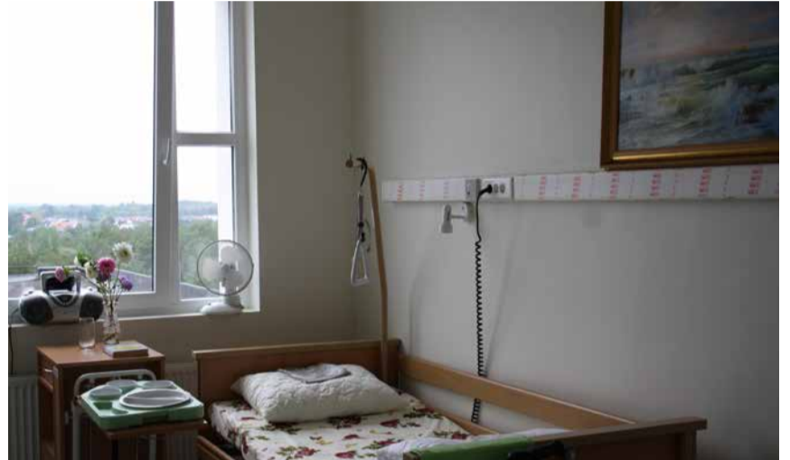
Uued ruumid Keilas on kavandatud moodsa hooldusravi nõudeid silmas pidades. Kõikide voodite juures on kutsunginupud, põrandatel on öine valgustus turvalisuse tagamiseks

Loomulikult töötab hooldekodus ka arst. Täiendavate teenustena pakuvad hooldekodu koostööpartnerid pediküü-