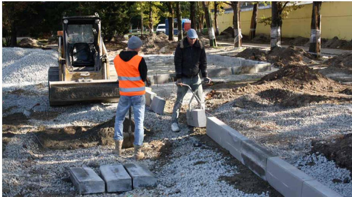
Esimese etapi tööde tähtaeg on 2015. aasta novembri lõpp. Jõuluajaks saab seega uus park juba kasutamiskvalifikatsiooniga, kuigi osad haljastustööd lõukuvad kevadesse

„Öist režiimi tänavavalgustuses ei saa siiski käsitleda säästurežiimina selles mõttes, justkui valla poleks raha võimalike lisakulude katmiseks. Küsimus on pigem mõistlik-