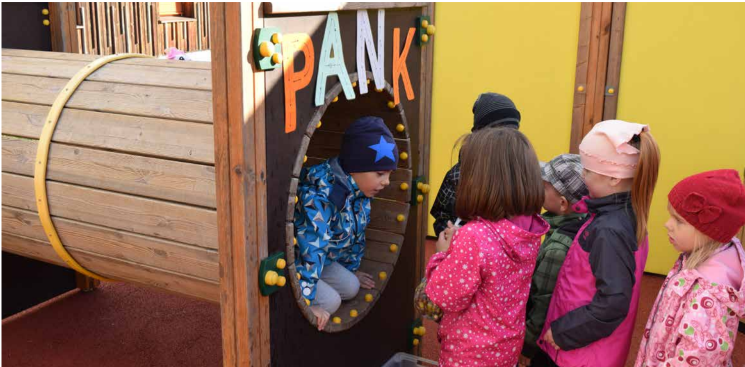
□ Juhuks kui miiklilaadalistel olid „näpud põhjas“, oli avatud ka pangaautomaat, millest plaksutamise või küki eest võis saada uut „raha“