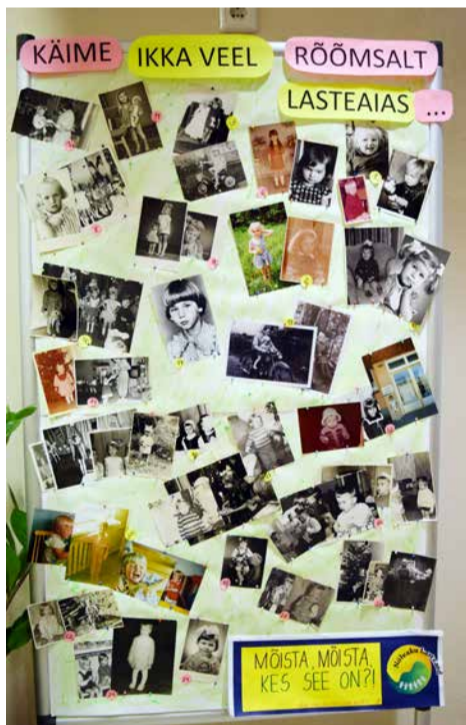
□ Fotonäitusel „Käime ikka veel rõõmsalt lasteaia“ on esindatud kõikide Nõlvaku lasteaia töötajate pildid ajast, mil nemad olid veel lasteaialapsed

kohal Päikseplik, kes pidulikult heiskas lastega koos Saue valla lipu. Ettevalmistused laadaks toimusid koostöös lastevanematega. Müügitteidelt võis leida nii puu- ja juur-