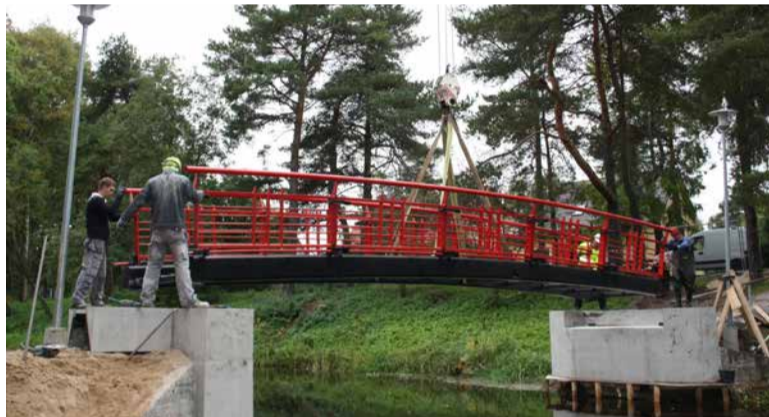
Edasi arendatakse ka teisel pool teed olevat jõeäärset pargiala – juba sel sügisel sai paika uus jalakäijate sild, eelmisest tublisti suurem, laiem ja kenam ka

Keskusväljaku leiavad kohad mõned muusikainstrumentid – trummid, ksilofon, harf – mis on kõikidele kasutamiseks-katsetamiseks. Muidugi mõista ei ole need pärisplindid, pigem on tegemist omamoodi skulptuuridega, avaliku ruumi ilmetavate elementidega, mis an-