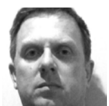
TARVO VAU LC Laagri

Augusti eelviimasel nädalavahetusel toimusid Vanamõisas järjekordne laad ja suvelõpupidu. Nagu eelnevatel aastatel, olid ka sel korral Laagri Lionsi klubi toimekad liikmed välja tulnud oma heategevusliku toilitlustusega.