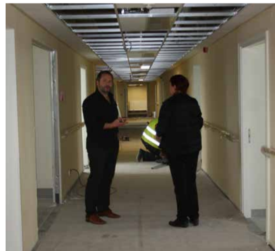
Septembri alguses oli Keila hooldekodu remont veel pahteldamisjärgus, ukseid avatakse plaanide kohaselt hiljemalt detsembriks

ri, jalaravi diabeedist tingitud haavandite puhul, juuksuriteenuseid.