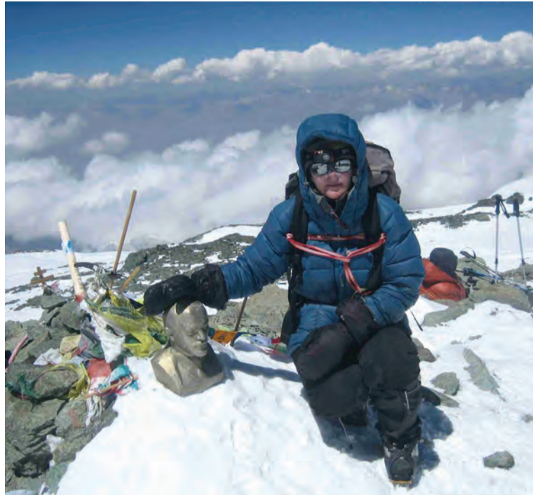
Lenini tipus 7134 meetri kõrgusel.