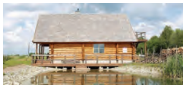
Koppelmaa külas asuva Endla Talu saunamajas on esimesel korrusel puuküttega saun suure leiliruumiga, samuti kööginurk, kaminasaal ja väljas tiik. Maja teisel korrusel magamistoad kokku 16 voodikohaga.