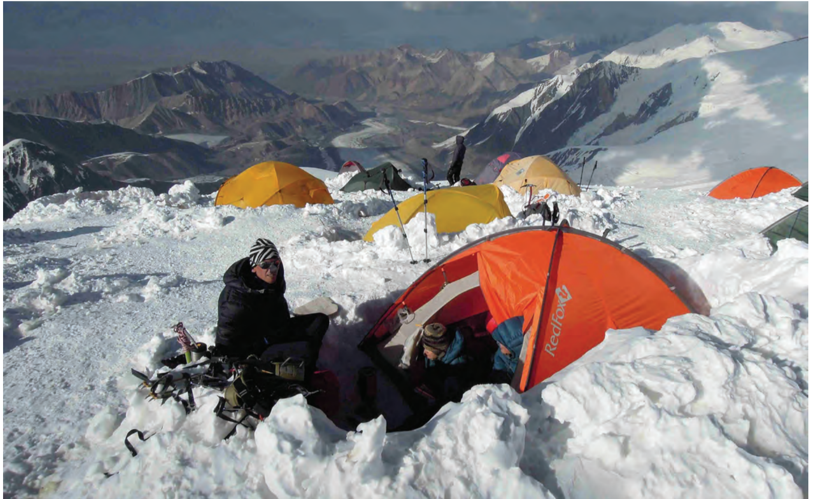
Hotellituba 6100 meetri kõrgusel.

Minu olulisema varustuse hulka kuulusid kirka, spetsiaalsed mägironimiseks mõeldud soojad