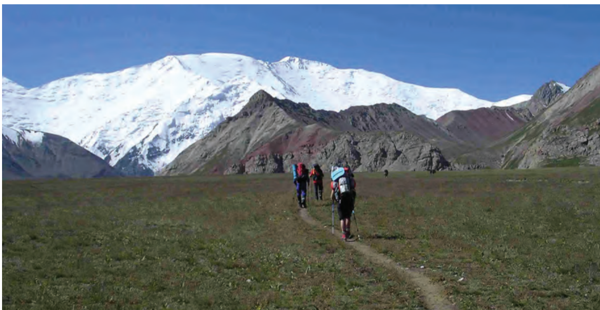
Mäed kutsuvad enda juurde.

öösel sadanud lume raskuse all kokkuvajunud telgis.