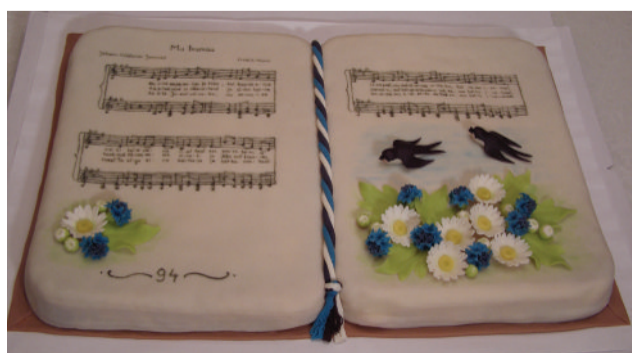
□ Eesti hümniga lauluraamat Vanamõisa Seltsimaja ööklubisse eelmisel aastal