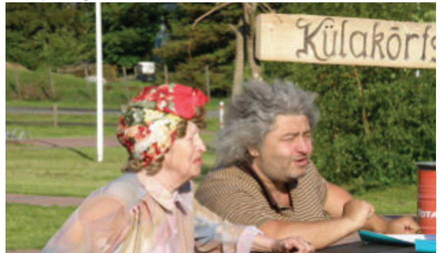
Näitemäng „Vanamõisa legendid“