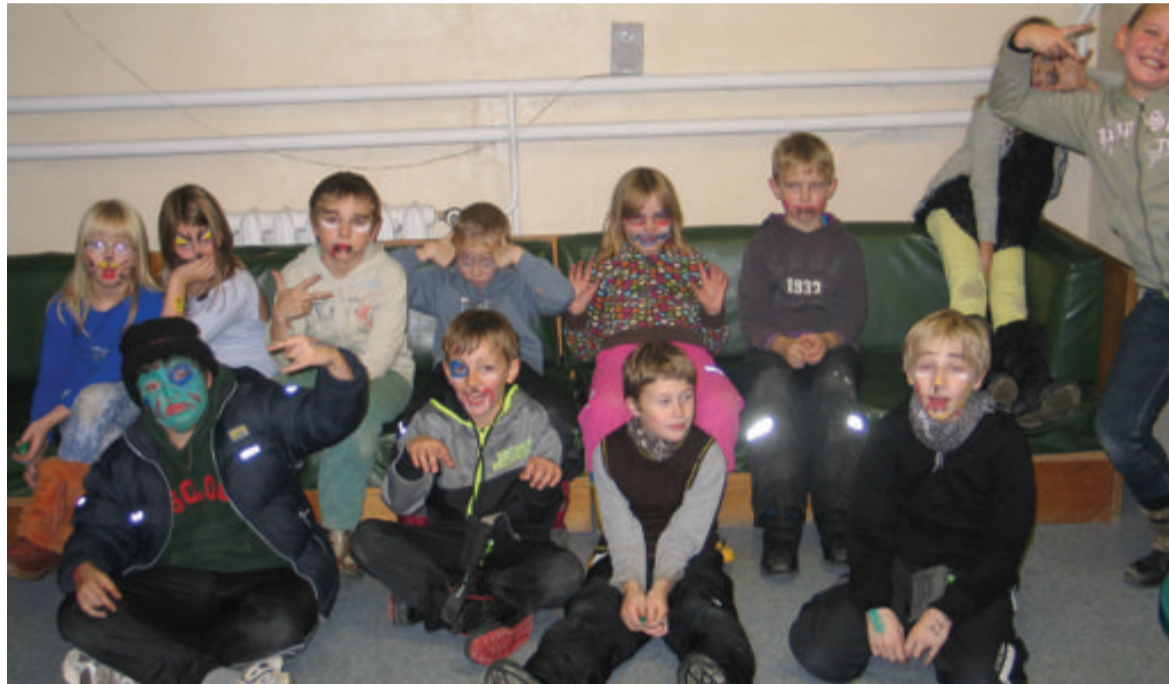
Ääsmäe Noortekeskus Exit ootab enda juurde noori igal tööpäeval peale koolitunde.

Saue valla noorsootöö kvaliteedi keskmiseks hindeks oli 2,2 (maksimumhindest 4). Seega - arenguvajadus on olemas, ehk noored vajavad rohkem tähelepanu ja neile suunatud tegevusi. Kõige problemaatilisem on olukord noortele suunatud ettevõtlikkuse arendamisel ehk noortele ei ole tagatud mitmekülgset võimalust ettevõtlikkuse suurendamiseks. Samuti on vaja leida aktiivseid noori, kes tahaksid kaasa rääkida läbi osaluskoegade, et edasi anda valla juhtidele noorte soove ja nägemusi.