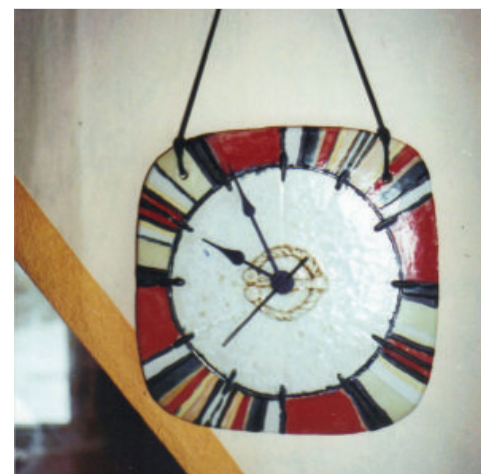
Rahvusliku motiiviga seinakell

Omaltpoolt oleme aidanud kohalikeks ja riiklikeks tähtpäevadeks /aktiivile/ kingituste valmistamisega. Eriti õnnestunud olid rahvaliku motiiviga valmistatud seinakellad. □