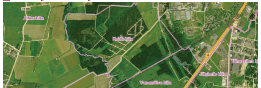
Koidu küla asutamine

mildest on rõõmu nii suurtele kui väikesetele tegijatele.