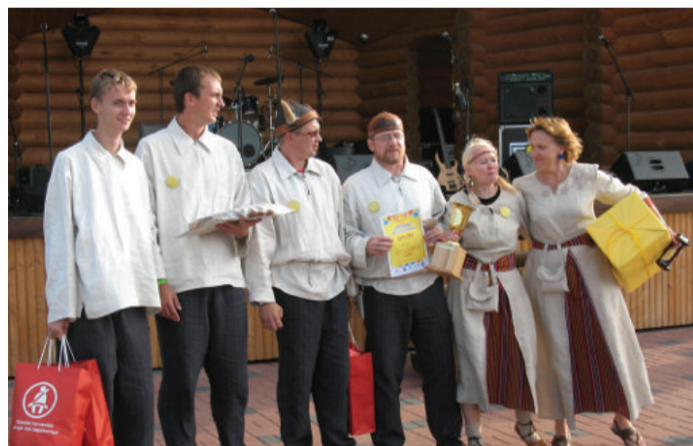
Külagogu eestvedamisel on Ääsmäe küla võtnud osa iga-aastasest Vanamõisa külapäevadest-sügisüritusest 2010. ja 2011. aastal on Nelja valla Talendikama küla võistlustel Ääsmäe küla võitnud ka esikohad.