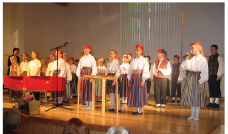
2011. aastal viidi läbi „Ääsmäe küla ja Ääsmäe kooli juubeliüritus“, mis kestis terve nädala ja kaasatud olid kõik Ääsmäe organisatsioonid, vanuse- ja huvigrupid.

Viimased kolm-neli aastat on Ääsmäel ellu viidud suuremahulised haljastustalgud „ Ääsmäe Iiusaks “, mille raames on paigaldatud haljastuselemendid Valdi (5-tee) risti, lilleamplid, roosid ja ilutaimed Kasesalu tänav äärde. Vahendite hankimist ja kokkukogutud prügi äravedu on rahastanud Saue Vallavalitsus, talgusööke on välja teinud