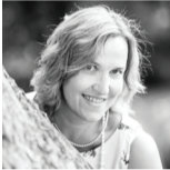
AVE KRUIUS MTÜ Ääsmäe Külagogu juhataja

Omal ajal 5-6 aastat tagasi, saime oma arengukava tehes kirja sellised puudujäägid paremast elust Ääsmäel: vähe ühistegevust (pidusid, talgud, teatri, kino ja kontserdi ühiskülastusi), kesine osavõtt Saue valla külade päeval, infopuudus ja puudulik infovahetus, küla oma veebilehe puudumine, puuduvad terviserajad, jooksurajad/suusarajad, kergliiklusteed – mille ääres on puhkekohtad, laste mänguväljakuid on vähe, spordiplatsid on niimata, noorte tegevusetus, prahi panemiseks puuduvad tänavaprügikastid, teede äärsete alade niitmine, tänavavalgustuse puudumine mõisa allee ääres ja jalgte puudumine kogu allee ulatuses.