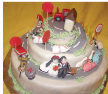
□ Terve elulugu tordil (vasakul)