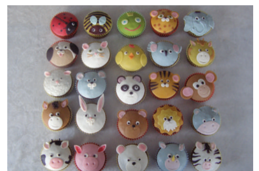
□ Tavalised muffinsid on saanud martsipanist loomakeste näod