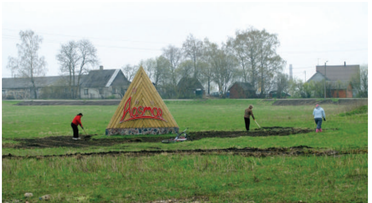
2011. aasta Leader - meetme kevadvooru raames „Muinasküla Ääsmäe“ toel projekteeriti ja paigaldati külatäht

2011. aastal viisime läbi „ Ääsmäe küla ja Ääsmäe kooli juubeliürituse “, mida finantseeris Saue Val-