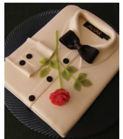
□ Sünnipäevatorit, mis sobib härrasmehele (üleval)