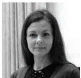
EVA PUKK MTÜ Nelja Valla Kogu

Nelja Valla Kogu (NVK) sügisvoor 2012, ehk viimane Leader-programmi 2007-2013 perioodil, on läbi saanud ning toetust saanud projektid kinnitatud. Kokku esitati sügisvoorus Nelja Valla Kogule 48 taotlust: Harku vallast 19, Saue vallast 13, Saku vallast 10 ja Kiili vallast 6.