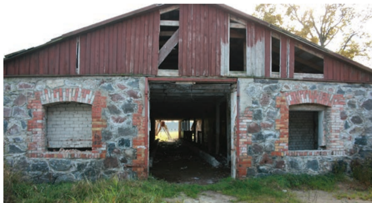
☐ Külal on plaanis võtta kasutusele Tuula küla südames paiknev maakivist hoone, mis saaks Tuula ja Pällu külade ühiseks seltsimajaks.

Vanamõisa Vabaõhukeskus areneb veelgi. MTÜ Vanamõisa Küla esitas taotluse „Katusega väliterrassi ehi-