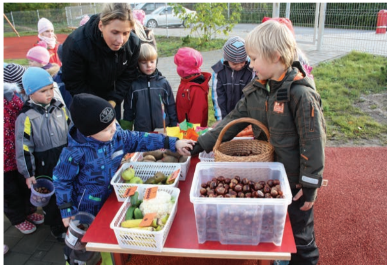
☐ Kastan sulle, kartul mulle. Äri käib.

Kogu ostetud kraam koguti kokku õpetajate ja õpetaja-abide hiigelkorvidesse, et hiljem rühmas sellest valmistada smuuti/salat/suupiste/pirukas. Pisemad kujundasid rii-vitud, hakitud köögiviljadest salatinäo: põskedeks banaaniviilud,