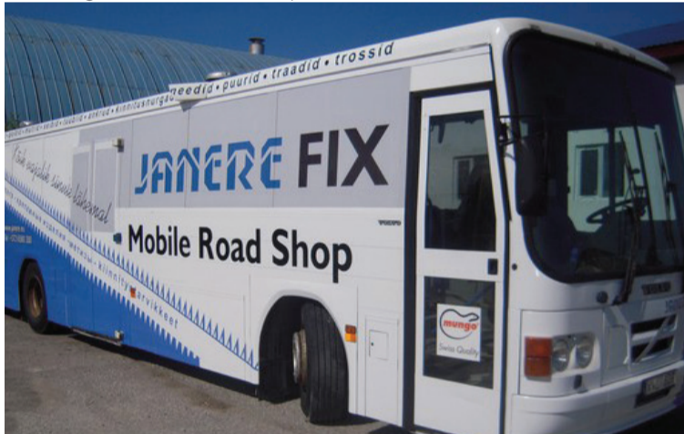
☐ Innovaatiline turundusvõte – liikuv autokauplus, mis sisustatud nagu üks lahvkabuss kunagi – tooted riulitel, ainult et harjumuspärase piima-vorstisaia asemel on riulitaskutes mutrid, konksud, kruvid.