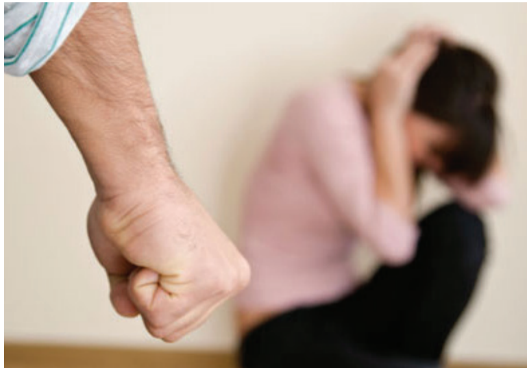
□ TALLINNA NAISTE KRIISIKODU VALVETELEFON 5264697 (TÖÖTAB TÖÖPÄEVITI KELL 11.00-22.00 JA PUHKEPÄEVITI 15.00-22.00)

Millises peres ei esineks konflikte? Peretüli tekib, kui kahel inimesel tekivad erinevad arvamused ja arusaamad. See on riid kahe võrdse partneri vahel ja ühiste seisukohtade väljaselgitamine. Perevägivald on ühelt poolt teisele suunatud alandamine, ähvardamine, terroriseerimine, peksmine ja vägistamine. Erinevus peretülist on ka see, et perevägivald on mitte harva esinev, vaid süstemaatiline, sageli korduv ja aina tõsisemate etteheidete ja vägivalda aktidega teadlik tegevus.