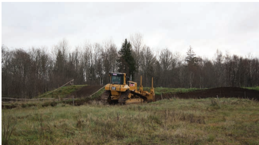
Enne ja pärast. Kolm päeva tööd ja küngaste asemel on tasane maa.

Kohtuotsustele vaatamata omanik ja haldaja määratud tähtjaks siiski rajatis vabatahtlikult likvideerima ei asunud. Kuigi seadusandlik võimalus