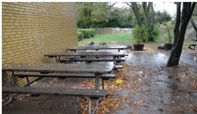
□ Taanis on ressursikasutus pragmaatilisem. Sügisel allasadavaid leheliblesid ei tormata ükshaaval kokku korjama. Seda tehakse siis, kui puud juba päris paljad.

Omavalitsuses ringi liikudes jäi mulje, et kuvand põhjamaisest kõrgest kvaliteedist igas valdkonnas on pigem linnalegend. Näiteks meie Laagri Kool on kindlasti oma füüsilise keskkonna poolest paremal tasemel kui sealne kü-