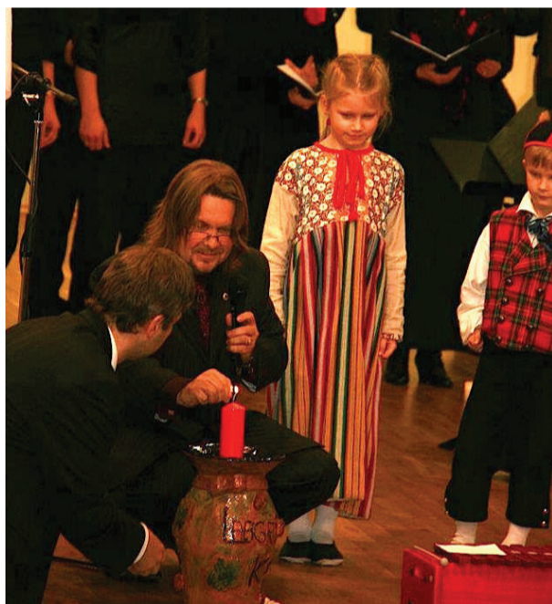
□ Wannamoisa segakoori imekauni laulu lõppedes süüdati Ääsmäe laste õhinat täis pilkude toel selle jõuluaja esimene advendiküünlal.