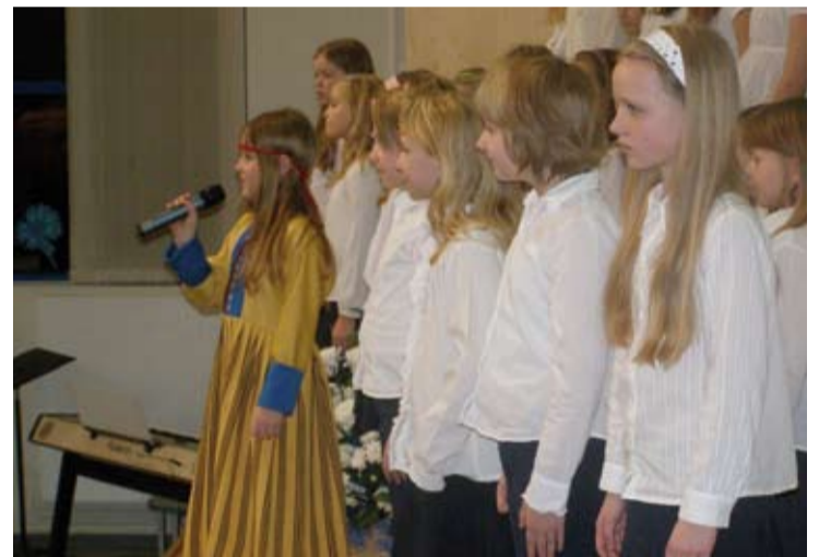
IGAL AJAL ARMAS: Laagri Kooli lapsed pakkusid meeleoluka programmi läbi luule- ja laulusalmide

Lisaks kontsertaktusele, on Saue vallas juba tavaks saanud, et Eesti Vabariigi aastapäeval tunnustatakse tänukirjaga vallakodanikke, kes esile töstmist väärivad. Selgi korral said vallavanema käepigistuse ja tänusõnad mitmed inimesed, kelle tegutsemisvaldkonnad ulatusid külaelu arendamisest kuni laste õpetamise ja ürituste korraldamiseni välja. Kandidaate said eelnevalt esitada kõik inimesed ja vallas tegutsevad ühingud, nii et tulemus peaks peegeldama üsna adekvaatselt pilti meie kõige tublimatest ja tunnustust väärivatest kodanikest.