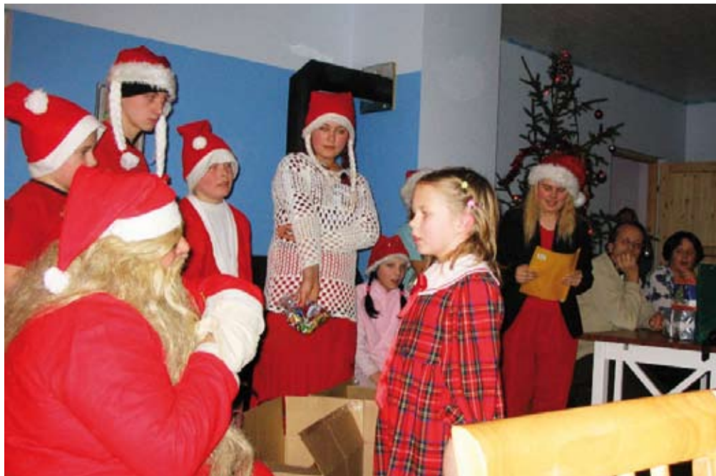
TIIMIGA KOHAL: Maidla lapsed külastas Jõuluvana koos rohkearvulise päkapiku meeskonnaga