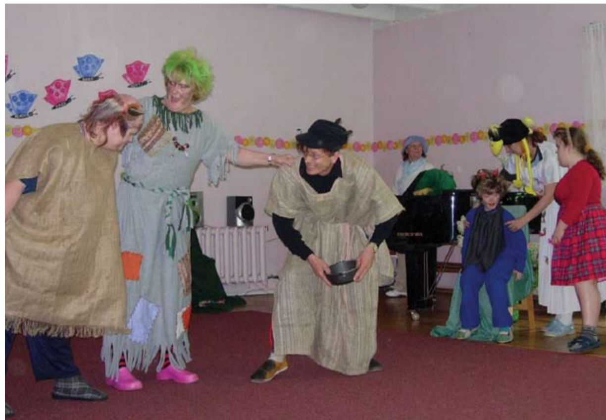
Parlamendiliikmetele pakkusid omapoolse teatrinägemuse „Nukitsamehest“ Salu Kooli õpilased ja koolipere.